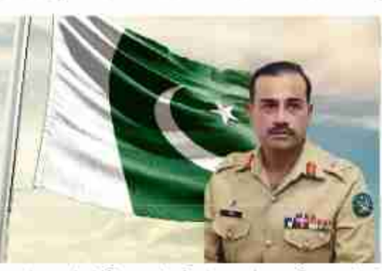
असिम मुनीर ने भारत पर यह भी आरोप लगाया कि जब पाकिस्तान आतंकवाद के खाले के करीब पहुंच रहा था, तब भारत जानबूझकर क्षेत्र में तनाव पैदा कर रहा था।

पाकिस्तान के सेना प्रमुख असीम मुनीर ने हाल ही में दावा किया है कि भारत ने बिना किसी उकसावे के पाकिस्तान पर दो बार हमला किया है। उन्होंने इसे भारत की शरणनीतिक दूरदर्शिता की वित्ताजनक कमीर बताया। मुनीर ने भारत को क्षेत्रीय तनाव बढ़ाने के लिए जिम्मेदार ठहराते हुए कसम खाई कि मविध्य में किसी भी भारतीय आक्रमण का पाकिस्तान निष्पक्ष जवाब देगा। शनिवार को कराची में पाकिस्तान नौसेना अकादमी में बोलेते हुए मुनीर ने पाकिस्तान को शत्रुतापूर्ण स्थिति वाला देश बताया। उन्होंने दावा किया कि इस्लामाबाद ने शबिना किसी उकसावे के भारतीय सैन्य आक्रमण का इस्लामाबाद जवाब