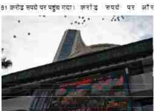
शीर्ष 10 कंपनियों में सबसे अधिक लाभ में रिलायंस इंडस्ट्रीज की रही। भारतीय एयरटेल की बाजार वैल्यू 51,880.85 करोड़ रुपये बढ़कर 11,58,329.94

सेंसेक्स की शीर्ष 10 सबसे मूल्यवान कंपनियों में से नौ के बाजार पूंजीकरण (मार्केट कैप) में पिछले सप्ताह कुल मिलाकर 2,34,566.53 करोड़ रुपये की बढ़ोतरी हुई। शेयर बाजार में तेजी के रुझान के बीच सबसे अधिक लाभ में रिलायंस इंडस्ट्रीज रही। बीते सप्ताह बीएसई का 30 शेयरों वाला सेंसेक्स 1,660.73 अंक या दो प्रतिशत घट गया। शीर्ष 10 कंपनियों में सिर्फ इन्फोसिस के बाजार मूल्यमान में गिरावट आई। समीचीन सप्ताह में रिलायंस इंडस्ट्रीज का बाजार मूल्यमान 89,556.91 करोड़ रुपये बढ़कर 20,51,590.