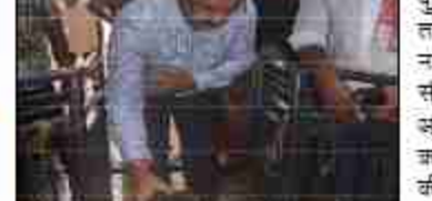
डीएम व एसपी ने श्रद्धालुओं सहित अत्यंत संबंधित व्यक्तियों का निरीक्षण कर लिया जायजा।

जयस्था दुरुस्त रखने के लिए सम्बन्धित को निर्देश दिए गये। अधिकांशिक क्षेत्रों के लिए लगने वाली लाइन की बिरकीटिंग व कट डायवर्जन के बारे में भी जानकारी ली। जिलाधिकारी एवं पुलिस अधीक्षक ने बाबा तामेधरनाथ धाम में आये हुए नागरिकों/श्रद्धालुओं से आपसी सौहार्द एवं शांति व्यवस्था का अनुपालन करते हुए भगवान शिव का जलामिषिक करने की अपील की। अधिकारियों द्वारा मंदिर परिसर, पोखरा आदि के आसपास सुरक्षा व्यवस्था प्रबलन का निरीक्षण करते हुए जायजा लिया गया तथा संबंधित अधिकारियों/कर्मचारियों को निर्देशित किया गया कि पूजा-अर्चना तथा जलामिषिक के दौरान शिव-मत्तो को कोई अनुचित न हो इस बात का विशेष ध्यान दिया जाए। इस अवसर पर कानून एवं सुरक्षा व्यवस्था के सुचारु संचालन में लगाए गए अधिकारी/कर्मचारी सहित अन्य संबंधित आदि उपस्थित रहे।