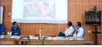
डीएम व एसपी ने श्रद्धालुओं सहित अत्यंत संबंधित व्यक्तियों का निरीक्षण कर लिया जायजा।