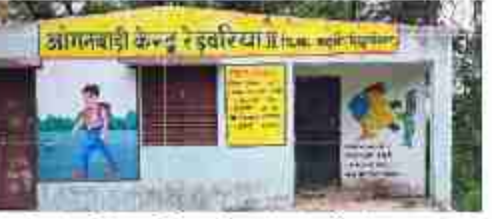
आंगनबाड़ी केंद्रों पर लटक रहे हैं ताले।

सुपरवाइजर व सीडीपीओ की है। केंद्रों पर सोमवार सुबह 10 से 12 बजे तक ताले आंगनबाड़ी केंद्र में सोमवार को लगे थे। हिन्दी दैनिक बुद्ध का