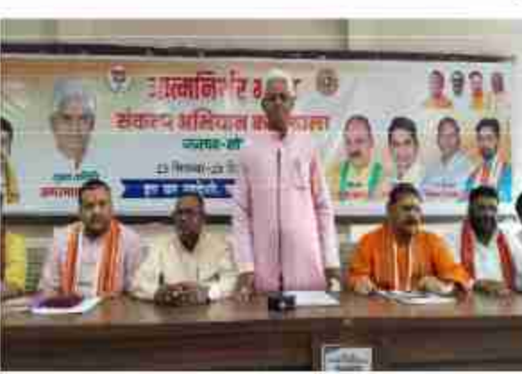
कहा कि इस अभियान का उद्देश्य देश को उन सभी विदेशी निर्भरताओं को समाप्त करना है जिसके चलते आज भारत का ज्यादातर व्यापार वस्तुओं पर आत्मनिर्भर भारत निर्भर है यह अभियान वस्तुओं पर निर्भरता को नियंत्रित करते हुए अच्छी गुणवत्ता वाले स्वदेशी उत्पादों को अपनी भूमि पर तैयार करने की सीख देता है इस अभियान का उद्देश्य भारत के उद्योगों में सुधार लाकर युवाओं को लिए रोजगार सृजन करना है इस