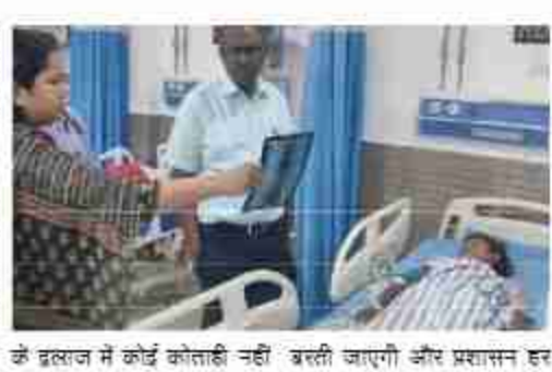
के इलाज में कोई कोताही नहीं बरती जाएगी और प्रशासन हर

दैनिक बुद्ध का संदेश महाराजगंज। जिले के सिंदूरिया थाना क्षेत्र के लक्ष्मीपुर अखंडगा गांव में गुरुवार रात हुई एक खूब फायरिंग की घटना ने पूरे इलाके को हिलाकर रख दिया है। चोर और ड्रोन की अफवाह के बीच एक युवक ने अपनी लड़केसी बंदूक से फायरिंग कर दी, जिसकी चपेट में आकर तीन मासूम बच्चियां और एक बुजुर्ग महिला गंभीर रूप से घायल हो गई।