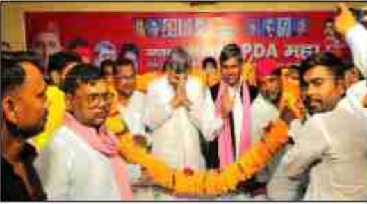
पीडीए एक सकारात्मक नारा है जो सभी वर्गों को साथ लेकर नई व्यवस्था बनाने का संकल्प देता है।