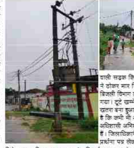
दैनिक बुद्ध का संदेश शोहरतगढ़/सिद्धार्थनगर। तहसील शोहरतगढ़ अंतर्गत बड़नी ब्लॉक के विद्युत उपकेंद्र डेबकभा अंतर्गत ग्राम पंचायत औरहावा में ट्रांसफार्मर लगा हाइड्रेशन विद्युत तार घासा बिजली का टो खम्मा तीन सप्ताह पहले एक वाहन की टोकर से टूटकर क्षतिग्रस्त हो गया। अभी तक टूटे हुए खम्मा को सहारे ही रही विद्युत सप्लाई से लोग डरे सहमे रहते हैं। औरहावा गांव में प्रवेश करने वाली सड़क किनारे प पंचायत भवन के सामने लगे बिजली खम्मा को राशन लठी गाड़ी ने टोकर मार दिया। ग्रामीणों ने गाड़ी टोकर से बिजली खम्मा के टूट जाने की सूचना बिजली विभाग के कर्मचारियों व अधिकारियों को दिया। लेकिन अभी तक खम्मा बदला नहीं गया। टूटे खम्मे पर ट्रांसफार्मर लटका पड़ा है। ट्रांसफार्मर के दोनों पोल के टूट जाने से खतरा बना हुआ है। इन्हीं खम्मा के सहारे बिजली की आपूर्ति हो रही है। लोगों को आशंका है कि कभी भी अग्रिय घटना घटित हो सकती है। पुरांचल विद्युत वितरण निगम लिमिटेड अधिशासी अभियंता सुरेंद्र कुमार को ग्राम प्रधान चंद्रावती ने समस्या की जानकारी दे चुकी है। जिलाधिकारी की अध्यक्षता वाले तहसील सम्पूर्ण समाधान दिवस में समस्या सम्बन्धी प्रार्थना पत्र लेकर गांव के अकबर अली, नसरतौन, तौषाब अली, टीपचंद, सटीप गुप्ता दिनेश गुप्ता, शिष कुमार, धरुव चंद, मिठाई साल, वासुदेव शिष शंकर, अर्जुन, शिष कुमार, मंगेश कुमार, नीतीश, ताजुद्दीन पंकज कुमार पांडेय जहागीर आदि लोग तहसील पर गये थे। ग्रामीणों का कहना है कि बिजली विभाग के कुछ लोग प्रार्थना पत्र जिलाधिकारी तक नहीं ले जाने दिये। लोग समस्या समस्या समाधान के अन्वयात्न पर रापस चले जाये, लेकिन तीन सप्ताह से समस्या बनी हुयी है। इस सम्बन्ध में अधिशासी अभियंता सुरेंद्र कुमार ने कहा कि समस्या समाधान की कार्यवाही चल रही है।