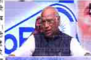
काम है। उन्होंने देश से झूठ बोला कि हर साल युवाओं को 2 करोड़ नौकरी दूंगा, पिंटेरा से कालावन लाखों सबको 15-15 लाख दूंगा किसानों को 100 दूंगा और बैकवर्ड क्लास की आमतदनी बढ़ा दूंगा। कांग्रेस अध्यक्ष ने दावा किया कि नरेंद्र मोदी संसद तक में झूठ बोलते हैं। इसलिए हमें लोगों को समझाना चाहिए कि नरेंद्र मोदी देश को गुमराह कर रहे हैं और झूठ बोलने वाले जन

तानमंत्री देश समाज का भला नहीं कर सकते। उन्होंने कहा कि किसी भी समाज को तीन चीजों की जरूरत है। विचार (शिक्षा), मनुष्य बल और आर्थिक बल। इन तीन चीजों में से किसी को पास एक भी नहीं है तो आगे नहीं बढ़ सकता। हम सभी को जागृत करना है। लेकिन हमें एकजुट रहना है। हिम्मत के साथ कांग्रेस पार्टी का साथ देना है। जिस तरह से आजादी के समय लोगों ने साथ दिया था, वैसे ही अगर आप लोगों ने हमारा साथ दिया तो कांग्रेस पार्टी को कोई हिला नहीं सकता। उन्होंने कहा कि 1983 की जाति जनगणना होने चाहिए- ये कहने की हिम्मत सिर्फ राहुल गांधी जी ने दिखाई। इसलिए हम सभी को राहुल गांधी जी का साथ देना है। राहुल गांधी जी पिछड़े-पछिलों का साथ देते हैं उनका समर्थन करते हैं उनके हक के लिए लड़ते हैं- ऐसे में आपको उनका साथ देना ही चाहिए।