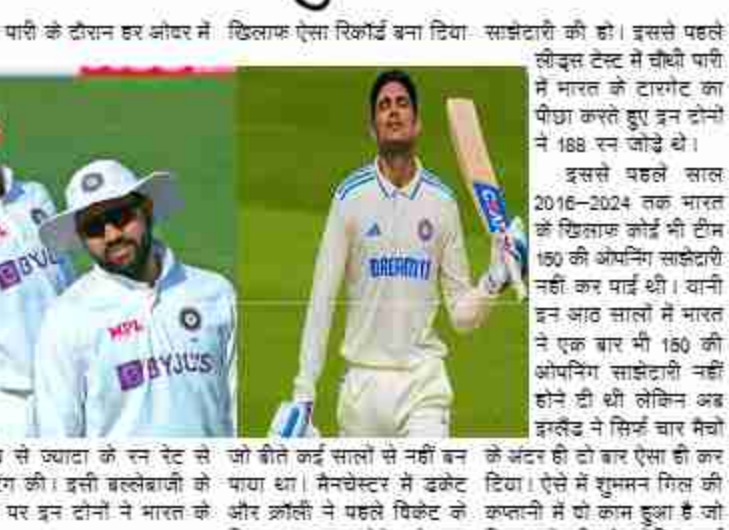
शुभमन गिल ने विराट कोहली और रोहित शर्मा के रिकॉर्ड को तोड़कर 100 रन बनाए।

भारत और इंग्लैंड के बीच चौथा टेस्ट मैच खेला जा रहा है। जहां इंग्लैंड की पारी में बैटबॉल देखने को मिला। इंग्लैंड के ओपनर्स ने अपनी पहली पारी में खूब लेजी से रन बनाए। भारतीय गेंदबाज इस दौरान बुरी तरह से केल नजर आए। जसप्रीत बुमराह, अंशुल कंबोज, मोहम्मद सिराज और शार्दूल ठाकुर सभी ने निराश किया।