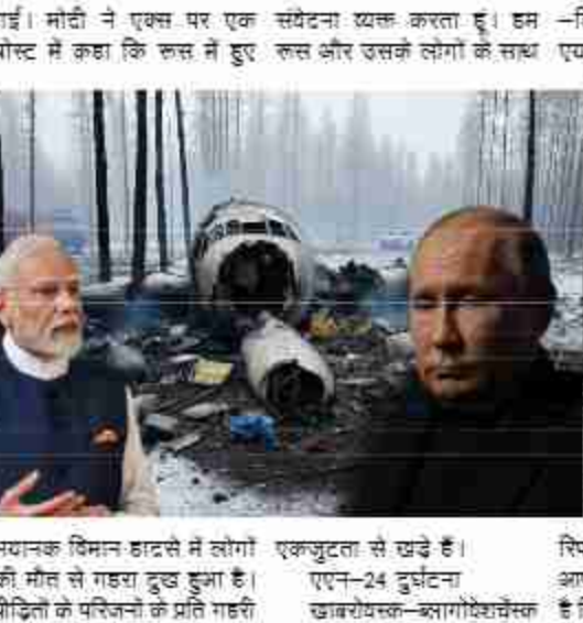
प्रधानमंत्री नरेंद्र मोदी ने रूस में हुए विमान हादसे में लोगों की मौत पर दुःख जताया।

गई। मोदी ने एक्स पर एक पोस्ट में कहा कि रूस में हुए संघटना व्यक्त करता है। हम रूस और उसके लोगों के साथ एकजुटता में खड़े हैं। एएन-24 दुर्घटना खाबरोव्स्क-ब्यागोदेशेव्स्क रिपोर्टों में थोड़ी भिन्न होती है। आपातकालीन सेवाओं का कहना है कि 40 यात्री (दो बच्चों सहित) मर चुके हैं।