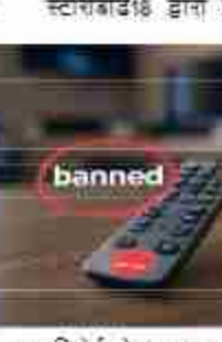
एक रिपोर्ट के अनुसार, सूचना एवं संचार आयोग (एम्आइबी) ने कथित तौर पर इंटर्नेट सेवा प्रदाताओं (आईएसपी) को भारत भर में 25 ओटीटी एप्स और वेबसाइटों तक सार्वजनिक पहुंच को अवरुद्ध करने का निर्देश दिया है।

नई दिल्ली। सूचना एवं संचार आयोग (एम्आइबी) ने कथित तौर पर इंटर्नेट सेवा प्रदाताओं (आईएसपी) को भारत भर में 25 ओटीटी एप्स और वेबसाइटों तक सार्वजनिक पहुंच को अवरुद्ध करने का निर्देश दिया है। ऑनलाइन अश्लील और पोर्नोग्राफिक सामग्री के प्रसार को रोकने के लिए एक महत्वपूर्ण कदम उठाते हुए, नक्स बिग शॉर्ट्स ऐप, नक्स और टेसीपिक्स जैसे लोकप्रिय प्लेटफॉर्म को सामग्री उल्लंघन के कारण बंद कर दिया गया है। 25 ओटीटी पर आपत्तिजनक सामग्री के लिए कार्रवाई