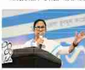
कोलकाता। बंगाली भाषा को लेकर उठे विवाद के बीच पश्चिम बंगाल की मुख्यमंत्री ममता बनर्जी ने एक और भाषा आंदोलन का आह्वान किया और आरोप लगाया कि कई स्थानों पर बंगाली बोलने के लिए लोगों को परेशान किया जा रहा है। इसहानात्मक सम्मान के पुरस्कार समारोह को संबोधित करते हुए, मुख्यमंत्री ममता बनर्जी ने कहा कि सभी को जागृत करने के लिए एक और भाषा आंदोलन की आवश्यकता है। कई जगहों पर बंगाली बोलने के कारण लोगों को परेशान किया जा रहा है। बंगाली बुनिया में पंचायी सबसे अधिक बोली जाने वाली भाषा है और एशिया में दूसरी सबसे अधिक बोली जाने वाली भाषा है।