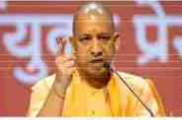
योगी की तकनीकी जांच हो। जहाँ जरूरत हो, वहाँ ट्रांसफार्मरों की क्षमता बढ़ाई जाए

ट्रिपिंग, ओवरबिलिंग और अनावश्यक कटौती अब किसी भी स्थिति में स्वीकार नहीं की जाएगी। इसमें सुधार करना ही होगा। उन्होंने बिजली विभाग के अधिकारियों से कहा कि राज्य में न पैसे की कमी, न बिजली की कमी और न ही संसाधनों की कमी है। ऐसे में व्यवस्था सुधार अर्थात् कार्रवाई लय है। शुक्रवार को प्रदेश की बिजली व्यवस्था की समीक्षा करते हुए मुख्यमंत्री ने ट्रिपिंग की लगातार आ रही शिकायतों पर नाराजगी जताई और निर्देश दिए कि प्रत्येक