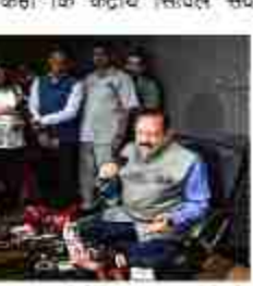
कहा कि केंद्रीय सिविल सेवा (अवकाश) नियम, 1972 के तहत केंद्र सरकार के कर्मचारी को अन्य पात्र अवकाशों के अलावा प्रतिवर्ष 30 दिन का अर्जित अवकाश 20 दिन का अर्ध-वेतन अवकाश, 8 दिन का आकस्मिक अवकाश और दो दिन का प्रतिबन्धित अवकाश प्रदान किया जाता है जिसका लाभ वे किसी भी व्यक्तिगत कारण से जिसमें बुजुर्ग माता-पिता की देखभाल भी शामिल है। सेवा नियमों के अनुसार विभिन्न प्रकार के अवकाश जैसे अर्जित अवकाश, आठ दिन का अवकाश, परिचरित अवकाश, देय अवकाश, नई असाधारण अवकाश, मृत्यु अवकाश, पितृत्व अवकाश, बाल देखभाल अवकाश, अध्ययन अवकाश, विरोध शिकलगत अवकाश, नापिकों का वैसावी अवकाश, अस्पताल अवकाश और विभागीय अवकाश होते हैं।

नई दिल्ली। केंद्रीय कर्मिक राज्य मंत्री जितेंद्र सिंह ने राज्यसभा में कहा कि केंद्र सरकार के कर्मचारी बुजुर्ग माता-पिता की देखभाल सहित व्यक्तिगत कारणों से 30 दिनों तक की छुट्टी ले सकते हैं। सेवा नियमों के अनुसार, सरकारी कर्मचारी 30 दिनों की छुट्टी के हकदार हैं, जिसका उपयोग व्यक्तिगत कारणों जैसे कि बुजुर्ग माता-पिता की देखभाल के लिए किया जा सकता है। एक लिखित प्रश्न का उत्तर देते हुए, केंद्रीय मंत्री ने कहा कि मौजूदा सेवा नियमों के तहत सरकारी कर्मचारी बुजुर्ग माता-पिता की देखभाल सहित किसी भी व्यक्तिगत कारण से प्रति वर्ष 30 दिनों तक अर्जित अवकाश ले सकते हैं। उन्होंने