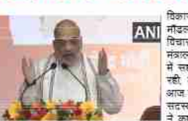
अमित शाह ने कहा कि सहकारिता नीति

नई दिल्ली। केंद्रीय गृह मंत्री अमित शाह ने गुरुवार को एक नई राष्ट्रीय सहकारिता नीति का अनावरण किया, जो पिछले 23 वर्षों से लागू एक नीति का स्थान लेगी। यह उस विभाग के लिए एक और मील का पत्थर साबित होगी जिसकी मुद्रिका नरेंद्र मोदी सरकार के तहत लगातार बंध रही है। सहकारिता मंत्रालय द्वारा जारी बयान के अनुसार, नई नीति देश में सहकारिता को मजबूत करने के केंद्र के उद्देश्य का हिस्सा है और 2025-46 तक यानी अगले दो दशकों के लिए भारत की सहकारिता आंदोलन में एक मील का पत्थर साबित होगी। अमित शाह ने कहा कि आज राष्ट्रीय सहकारिता नीति-2025 का शुभारंभ हुआ है। 2002 में भारत सरकार ने सहकारिता नीति पेश की थी। उस समय भाजपा की सरकार थी। और आज, 2025 में भाजपा सरकार द्वारा दूसरी सहकारिता नीति ललाई गई है। उन्होंने कहा कि सरकार का दृष्टिकोण, जो भारत को उसके विकास की ओर भारत के विकास के लिए आवश्यक सभी कारकों को समझता है, वही सहकारी क्षेत्र को महत्व दे सकता है। यदि देश और अर्थव्यवस्था की मूल इकाई समुदाय, रोजगारयुक्त और संयुक्त है, तो यह आर्थिक मॉडल कमी विफल नहीं हो सकता। शाह ने जोर देकर कहा कि सहकारिता नीति