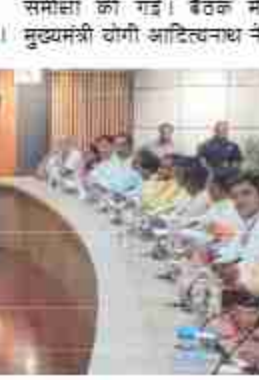
प्रमुख सचिव को स्पष्ट निर्देश दिए कि विधायकों की प्रामुख्यताओं के आधार पर ही कार्यों को स्वीति दी जाये। साथ ही उन्होंने कहा कि जो भी सड़क (रोड) गड़बड़ बनायेगा, उस ठेकेदार के ऊपर एफआईआर दर्ज करके जेल भेजा जायेगा।

यह जनप्रतिनिधियों के सुझावों और क्षेत्रीय जरूरतों को सर्वोच्च प्राथमिकता देने की दिशा में एक सराहनीय कदम है। मुख्यमंत्री के आन्धान से स्पष्ट है कि हमारी विधानसभा शोहरतगढ़ में भी जलद ही सड़क (रोड) का जाल बिछाएंगे और शोहरतगढ़ का विकास होगा। मुख्यमंत्री का इटय से आना, जिन्होंने विधायकों को आमन्त्रित कर सीधे संवाद किया और पीडब्ल्यूडी विभाग के कार्य की जमीनी हकीकत जानने का प्रयास किया। यह संवाद और समीक्षा का सिलसिला निरिचत रूप से उत्तर प्रदेश के विकास को और गति देगा।