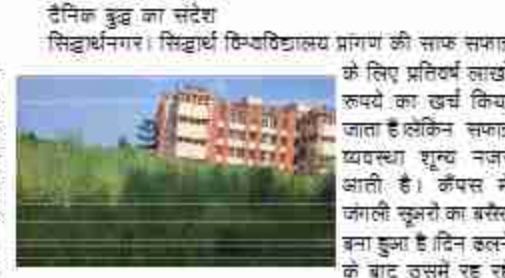
दैनिक बुद्ध का संदेश सिद्धार्थ विश्वविद्यालय प्रांगण की साफ सफाई के लिए प्रतिबंध लाखों रुपये का खर्च किया जाता है लेकिन सफाई व्यवस्था शून्य नजर आती है। कैंपस में जंगली सूअरों का बसेरा बना हुआ है। दिन इतने के बाद उसमें रह रहे छात्र-छात्राओं के परिवारों का खतरा बना हुआ है। झाड़ियों के बीच सिर्फ सड़के ही साफ नजर आती है। किस रस्ते कब जानवर हमला कर दे कुछ कहा नहीं जा सकता। अधिकारियों के रहने की सुरक्षा व्यवस्था चाक चौकट है लेकिन यह शिकायत कर रहे छात्र छात्राओं के लिए खतरा बना हुआ है। परिसर की साफ सफाई रहती तो दूर से भी जानवर नजर आ जाते,जिससे उनसे बचा जा सकता है। कुछ माह पहले लोग जानवरों के हमले से घायल होने की सूचना है। बताया जाता है कि रात्रि होते ही जानवरों का हलचल तेज हो जाता है। इन झाड़ियों में कोबर और अजगर भी देखे गए हैं। इतनी लागत के बावजूद भी सफाई न होना कहीं ना कहीं खर्च संदेह के घेरे आता है।