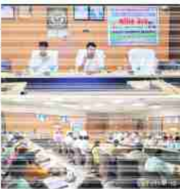
बीएचएनडी टिप्पण पर 02 रजिस्टर पूर्ण होना चाहिए जिसमें गर्भवती महिलाओं का विवरण एवं

जिलाधिकारी ने निर्देश दिया कि स्वास्थ्य विभाग एवं बाबू विकास विभाग का डाटा एक समान डौना चाहिए। जिलाधिकारी ने निर्देश दिया कि पुष्पाहार प्राप्त करने वाले लाभार्थियों का शत-प्रतिशत पर्यवेक्षण/ई-केवाईसी पूर्ण करावे। जिलाधिकारी ने निर्देश दिया कि टीएचआर प्लांट द्वारा प्रतिदिन उत्पादन किया जाये। जिलाधिकारी ने टीएचआर प्लांट का निरीक्षण करने का निर्देश दिया। जिलाधिकारी ने निर्देश दिया कि