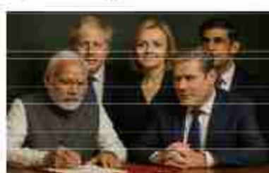
आखिरकार वे समझौता हुआ। बोरिस जॉनसन से लेकर लिज ट्रस और फिर सुनक तक कई ब्रिटिश प्रधानमंत्री आए और गए लेकिन भारत ने अपने धैर्य

आखिरकार वो दिन आ ही गया जब भारत और ब्रिटेन के बीच दो व्यापार समझौता साइन हो गया। जिसका इंतजार पिछले तीन साल से किया जा रहा था। खास बात ये है कि ये सिर्फ एक डील नहीं बरिफ अमेरिका जैसे शक्तिशाली देशों को एक संदेश है जो डेडलाइन की तलवार लटककर भारत से डील साइन करवाना चाहते हैं। दरअसल, प्रधानमंत्री नरेंद्र मोदी का युके दौरा शुरू हो चुका है और इस दौर में सबसे बड़ी घोषणा हो गई है। भारत और यूनाइटेड किंगडम के बीच बहुप्रतिक्षित फ्री ट्रेड एग्रीमेंट पर आधिकारिक रूप से इस्तफा हो गए हैं। करीब तीन साल और 14 दौरों की बातचीत के बाद