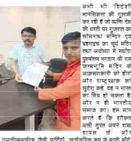
एआईएमआईएम जैसी पार्टियों सार्वजनिक रूप से माफी मांगें