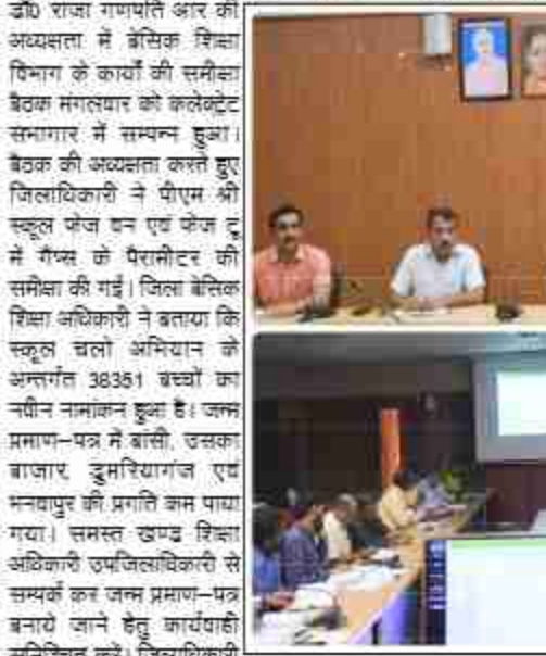
डीएम ने बेसिक शिक्षा विभाग के कार्यों की किया समीक्षा बैठक