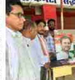
कायालय पर गुरुवार को कांग्रेस जनों ने नेता प्रतिपक्ष राहुल गांधी का जन्मदिन उल्लासपूर्वक मनाया। इस अवसर पर राहुल गांधी जी के चित्र के सामने जेक काटा गया और सबने एक दूसरे को जेक खिलाकर राहुल गांधी जी के जन्मदिन की बधाई दी। कांग्रेस जनों ने राहुल गांधी जी के स्वस्थ एवं दीर्घायु होने की कामना भी की। इस अवसर पर उपस्थित कांग्रेस जनों ने कहा कि राहुल गांधी जो देश के लाखों गरीबों, पीड़ितों के दुःख सुख में बड़ी मजबूती से

खड़े होते हैं और सबकी आवाज बुलन्द करते हैं। इसलिए आज कायालय पर गुरुवार को कांग्रेस जनों ने नेता प्रतिपक्ष राहुल गांधी का जन्मदिन उल्लासपूर्वक मनाया। इस अवसर पर राहुल गांधी जी के चित्र के सामने जेक काटा गया और सबने एक दूसरे को जेक खिलाकर राहुल गांधी जी के जन्मदिन की बधाई दी। कांग्रेस जनों ने राहुल गांधी जी के स्वस्थ एवं दीर्घायु होने की कामना भी की। इस अवसर पर उपस्थित कांग्रेस जनों ने कहा कि राहुल गांधी जो देश के लाखों गरीबों, पीड़ितों के दुःख सुख में बड़ी मजबूती से