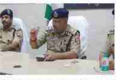
जॉरिए अवैध धर्मांतरण करने में संलिप्त था। पुलिस ने गिरोह का भंडाफोड़ करते हुए विभिन्न राज्यों से 10 आरोपियों को गिरफ्तार किया है। इनमें एक लड़की भी शामिल है।