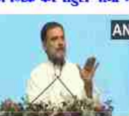
चाहते हैं। राहुल गांधी ने ने कहा कि मेक इन इंडिया के नाम पर हम सिर्फ असेंबली कर रहे हैं - असली मैनुफैक्चरिंग नहीं। आईफोन से लेकर प्ट तक - पुर्जे विदेश से आते हैं हम बस जोड़ते हैं। छोटे उद्यमी निर्माण करना चाहते हैं लेकिन नीति है न सपोर्ट। उल्टा भारी टैक्स और चुने हुए कॉर्पोरेट्स का एकाधिकार - जिसने देश के उद्योग को

नई दिल्ली। भारत को असेंबली हाउस से आगे बढ़कर एक सच्ची विनिर्माण शक्ति बनाने के लिए जमीनी स्तर पर बदलाव की जरूरत पर जोर देते हुए लोकसभा में विपक्ष के नेता राहुल गांधी ने शनिवार को कहा कि मेक इन इंडिया के नाम पर भारत सिर्फ उत्पादों की असेंबली कर रहा है। उनका सही मायने में निर्माण नहीं कर रहा। गांधी ने एकस्य पर एक पोस्ट में कहा कि भारत में बनने वाले उत्पादोंतर टीपी के 80 प्रतिशत कलपुर्जे चीन से आते हैं। उन्होंने आगे बताया कि नीति और समर्थन की कमी, भारी कर और निगमों का एकाधिकार उन छोटे उद्यमियों को रोक रहे हैं जो विनिर्माण करना