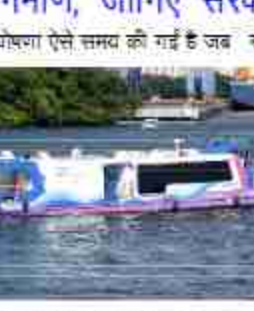
पटना में जल मेट्रो सेवा की शुरुआत के साथ सार्वजनिक परिवहन में एक बड़ा बदलाव देखने को मिलेगा - यह केंद्रीय बंदरगाह, जहाजघाटी और जलमार्ग मंत्री संबन्धित सोनीवाल द्वारा घोषित एक महत्वाकंक्षी पहल है।

पटना। बिहार की राजधानी पटना में जल मेट्रो सेवा की शुरुआत के साथ सार्वजनिक परिवहन में एक बड़ा बदलाव देखने को मिलेगा - यह केंद्रीय बंदरगाह, जहाजघाटी और जलमार्ग मंत्री संबन्धित सोनीवाल द्वारा घोषित एक महत्वाकंक्षी पहल है। यह पहल भारत के अंतर्देशीय जलमार्गों को टिकाऊ परिवहन, आर्थिक विकास और पर्यटन विकास के लिए उपयोग करने के सरकार के व्यापक प्रयास का हिस्सा है। पटना में जल मेट्रो गंगा नदी का उपयोग करके एक स्वच्छ, अधिक कुशल और पर्यावरण के अनुकूल शहरी परिवहन प्रणाली के रूप में काम करेगी। प्रस्तावित प्रणाली से नदी के दोनों किनारों को जोड़ने सड़कों पर भीड़भाड़ कम करने और हजारों दैनिक यात्रियों के लिए एक सज्ज आवागमन विकल्प प्रदान करने की उम्मीद है। यह