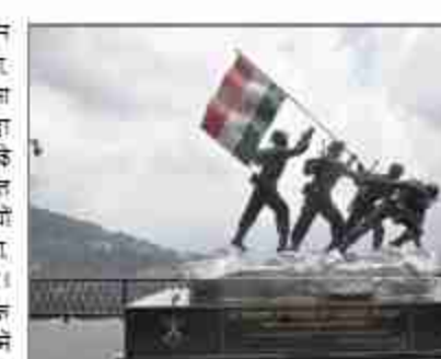
लेकिन आजसम्मान की ज्वाला बुझा नहीं पाए। विदेशी युद्धों में भी भारतीय सैनिक शाही आदेश का नहीं बल्कि आंतरिक सहिता का पालन करते थे। युद्ध सम्मान शाही पुरस्कार न होकर नैतिकता के प्रमाण थे। झंडा मले विदेशी रहा निष्ठा सदा भारतीय रही।

लूटने की बजाय सम्मान अधीन करने की जगह स्वाय देना, विरासत लूटना नहीं बल्कि बनाना उनका गुण था। भारत के योद्धा कभी भी धन से या धिकयों से गढ़े हुए नहीं रहे। वे एक सम्पदागत विरासत का उत्पाद हैं- साम्राज्यों से भी पुराना, सिद्धांत से भी गहरा, भाड़े के सैनिकों की संघ से इतर। जबकि अनेक उत्तर-औपनिवेशिक युद्धों को शाही सेनाएं विरासत में मिली भारतीय फौजी युद्ध के मैदान में कुछ और लेकर उतरता है रु नाम (सम्मान), नमक (कर्तव्य) और निशान (ध्वज) की सेवा के प्रति असीम दायित्व का संकल्प। यह ब्रिटिश उपहार नहीं, हमारी विरासत है। यह जो ब्रिटिश साम्राज्य जीत नहीं पाया : अरबों ने अपना झंडा मले फहराया हो। लेकिन वे हमारी आत्मा कभी नहीं जीत पाए। भारतीय सैनिक विदेशी झंडे को नीचे जकर लड़े लेकिन साम्राज्य के लिए नहीं। वे पलटन इज्जत और विरासत की खातिर लड़े। ईस्ट इंडिया कंपनी ने जबरदस्ती भर्ती तो कर ली, लेकिन आजसम्मान की ज्वाला बुझा नहीं पाए। विदेशी युद्धों में भी भारतीय सैनिक शाही आदेश का नहीं बल्कि आंतरिक सहिता का पालन करते थे। युद्ध सम्मान शाही पुरस्कार न होकर नैतिकता के प्रमाण थे। झंडा मले विदेशी रहा निष्ठा सदा भारतीय रही। 1971-विशेषपूर्ण कमान, भारत ने लान की खातिर पूर्वी पाकिस्तान में प्रवेश नहीं किया। नरसंहार छल करने को सीमा पार की। केवल 13 दिनों में भारतीय सेना ने एक राष्ट्र आजात कराया दू और वापस लौट आई।