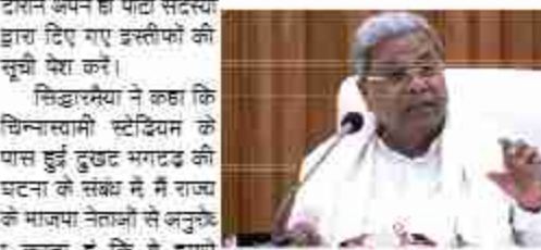
सिद्धारमेया ने कहा कि चिन्तास्थानी स्टेडियम के पास हुई भगदड़ के संबंध में मैं राज्य के माजपा नेताओं से अनुरोध करता हूँ कि वे हमारे इस्तीफे की मांग करने से पहले अतीत में इसी तरह की घटनाओं के दौरान इसीका देने वाले माजपा नेताओं की सूची जारी करें। चिन्तास्थानी स्टेडियम के पास जो हुआ वह एक दुर्भाग्यपूर्ण दुर्घटना है। एक जिम्मेदार सरकार के रूप में हमने इस घटना की जिम्मेदारी ली है। हमने बेंगलुरु शहर के पुलिस आयुक्त सचिन परिषद पुलिस अधिकारियों को निलंबित कर दिया है और राज्य खुफिया विभाग के प्रमुख का तबादला कर दिया है। मेरे राजनीतिक सचिव को भी उनके

बंगलुरु। जिस दिन माजपा नेताओं और कार्यकर्ताओं ने चिन्तास्थानी स्टेडियम के पास हुई भगदड़ को लेकर कर्नाटक के मुख्यमंत्री सिद्धारमेया और उपमुख्यमंत्री डी के शिवकुमार के इस्तीफे की मांग करते हुए विरोध प्रदर्शन किया, उस दिन मुख्यमंत्री सिद्धारमेया ने तीखा पलटवार करते हुए माजपा पर फ्लापपूर्ण तान के लिए इस त्रासदी का राजनीतिकरण करने का आरोप लगाया। सिद्धारमेया ने कड़े शब्दों में दिए गए बयान में माजपा नेताओं को चुनौती दी कि वे पहले अतीत में इसी तरह की घटनाओं के