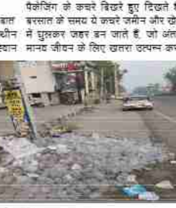
पैकेजिंग के कचरे बिखरे हुए दिखते हैं। बरसात के समय ये कचरे जमीन और खेतों में घुलकर जहर बन जाते हैं, जो अंततः मानव जीवन के लिए खतरा उत्पन्न करते हैं।