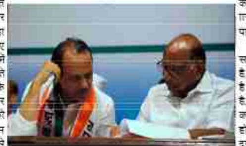
शरद पवार ने कहा कि बीजेपी के साथ जा रहा है तो यह कांग्रेस की विचारधारा नहीं है। कोई किसी के साथ भी जुड़ सकता है, लेकिन माजपा के साथ जाना कांग्रेस की विचारधारा के अनुरूप नहीं हो सकता। शरद पवार ने कहा कि इस अवसरवाद की राजनीति को

मुंबई। एनसीपी (सपा) सुप्रीमो शरद पवार ने मंगलवार को अपने भतीजे अजित पवार की अवसरवादी राजनीति पर परीक्षा रूप से कटाक्ष करते हुए कहा कि कुछ लोग सिर्फ सत्ता के लिए माजपा से जुड़े हैं। पिंपरी विधायक ने पार्टी कार्यकर्ताओं को संबोधित करते हुए शरद पवार ने संकेत दिया कि वह गांधी, नेहरू, फुले और अंबेडकर की विचारधारा को मानने वालों को साथ लेने के लिए तैयार हैं, लेकिन अवसरवाद की राजनीति करने वाले किसी भी व्यक्ति को कभी स्वीकार नहीं करेंगे। उन्होंने कहा कि यहां किसी ने अभी-अभी कहा कि सबको साथ लेकर चलने की जरूरत है। सबको साथ लेकर चलने में कोई टिक्कत नहीं है, लेकिन सब कौन हैं? मैं गांधी-नेहरू फुले और अंबेडकर की विचारधारा को मानने