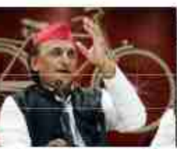
दल जो कुछ दिन पहले स्पष्टही नाथ देते थे, उन्होंने हमारे बाजार को पिटेसिओ से कब्जा कर दिया। इसके पहले परिवार को लखनऊ स्थित सभा मुख्यालय में विभिन्न जिलों से आए पार्टी कार्यकर्ताओं को संबोधित करते हुए यादव ने आरोप लगाया कि प्रदेश में अराजकता और प्रशासनिक अक्षय्यता का बोलबाला है। उन्होंने कहा कि माजपा नृ-माफियाओं को

लखनऊ। समाजवादी पार्टी प्रमुख अखिलेश यादव ने स्पष्ट किया कि ब्लॉक ब्लॉक पूरी तरह एकजुट है। इसके साथ ही उन्होंने कहा कि 2027 के उत्तर प्रदेश विधानसभा चुनाव में उनकी पार्टी बीजेपी के खिलाफ चूक। ब्लॉक के एकजुट होने के भीतर ही चुनाव लड़ेंगे। उन्होंने कहा कि लोकसभा चुनावों में मिली सफलता के बाद यह गठबंधन अभी भी मजबूत है और विधानसभा चुनाव में इसके जरिये ही मुकाबला होगा। उन्होंने कहा कि इंडिया गठबंधन बरकरार है, जो लोग गठबंधन छोड़ना चाहते हैं वे ऐसा करने के लिए स्वतंत्र हैं। वह 2027 यूपी विधानसभा चुनाव लड़ेंगे। अखिलेश