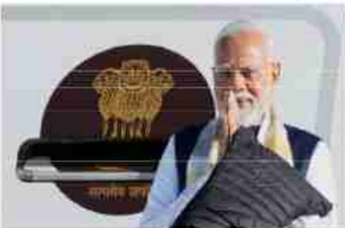
कनाडा के प्रधानमंत्री मार्क कार्नो ने सम्मेलन के लिए उन्हें आमंत्रित किया है। पीएम मोदी की जी-7 सम्मेलन में यह साइप्रस से कनाडा पहुंचे और

नई दिल्ली। प्रधानमंत्री मोदी ने कहा है कि यह कनाडा के कर्नलिकस में जी-7 शिखर सम्मेलन में वैश्विक नेताओं से मुलाकात के दौरान ग्लोबल साउथ समेत महत्वपूर्ण मुद्दों पर अपनी बात रखेंगे। तीन देशों के चार दिवसीय दौरे पर निकले प्रधानमंत्री की स्थानीय समवायुत्तर सोमवार शाम यहां पहुंचे और एक दशक में उनकी कनाडा की यह पहली यात्रा है।