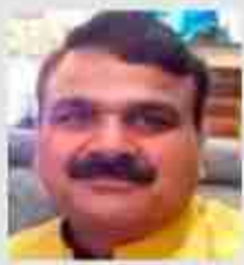
लेखक विनय कांत मिश्र / दैनिक बुद्ध का संदेश