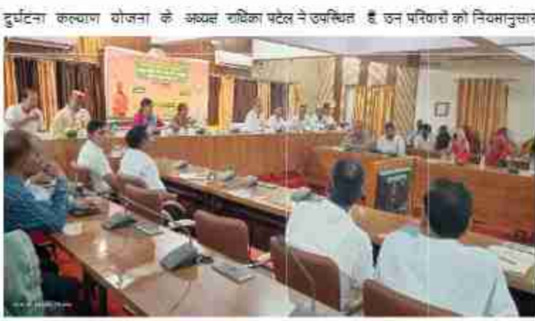
दुर्घटना कल्याण योजना के अन्तर्गत राशिका पटल में उपस्थित हैं उन परिवारों को नियमानुसार प्रसाद ने भी मुख्यमंत्री षक दुर्घटना कल्याण योजना के विषय में उपस्थित लाभार्थियों को विस्तार पूर्वक जानकारी दी और उन्होंने कहा कि यह बहुत ही महत्वपूर्ण योजना है, जिससे समस्या ग्रस्त परिवारों को आर्थिक सहायता प्रदान सरकार द्वारा उपलब्ध कराने का कार्य किया जा रहा है। इस दौरान जिलाधिकारी बीएनएच सिंह ने उपस्थित आश्रित परिवारों के लोगों को सम्बोधित करते हुए कहा कि मुख्यमंत्री षक दुर्घटना कल्याण योजना प्रदेश सरकार की महत्वपूर्ण योजना है, जिसके माध्यम से दुर्घटना ग्रस्त परिवारों को तत्काल सहायता राशि उपलब्ध कराने का कार्य किया जाता है। जनपद सोनमठ में मुख्यमंत्री षक दुर्घटना कल्याण योजना के 292 आश्रित परिवारों के खाते में 13 करोड़ 16 लाख

दैनिक बुद्ध का संदेश सोनमठ। मुख्यमंत्री द्वारा मुख्यमंत्री षक दुर्घटना कल्याण योजना के 11690 आश्रित परिवारों को 881.88 करोड़ सहಾಯता राशि के चेक वितरण कार्यक्रम का कार्यक्रम समाप्त कर दिया गया। कार्यक्रम के अंतर्गत 11690 आश्रित परिवारों को 881.88 करोड़ सहायता राशि के चेक वितरण कार्यक्रम का कार्यक्रम समाप्त कर दिया गया। कार्यक्रम के अंतर्गत 11690 आश्रित परिवारों को 881.88 करोड़ सहायता राशि के चेक वितरण कार्यक्रम का कार्यक्रम समाप्त कर दिया गया।