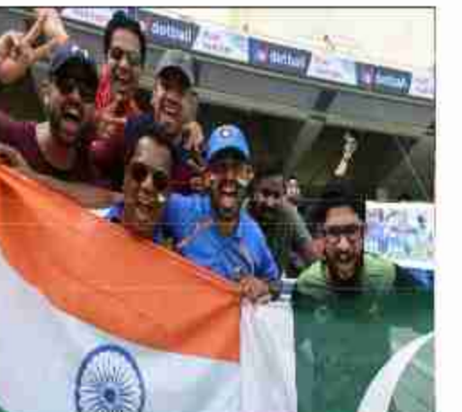
ही टीम इंडिया ने सुपर-4 के लिए अपनी जगह लगभग पक्की कर ली। वहीं अब उसका अगला मुकाबला 19 सितंबर को जमान के साथ होगा। फिलहाल, पाकिस्तान को परत कर भारत अपने गुप ए में टॉप पर काबिज है। उसके 4 अंक हैं। लेकिन यह कहानी अभी यही खत्म नहीं होगी बरिेक आगे और रोमांच आने वाला है। दरअसल, इस टूर्नामेंट में भारत और पाकिस्तान की टक्कर एक नहीं बल्कि दो बार हो सकती है। क्या है इसके पीछे का पूरा एक्-दूसरे से मिडिंगी। यानी इस बार एशिया कप 2025 में भारत-पाकिस्तान की टक्कर तीन बार हो सकती है। फिलहाल एशिया कप 2025 के छठे मुकाबले में भारत ने पाकिस्तान को 7 विकेट से रौं दे दिया। इस दौरान पाकिस्तान के बल्लेबाज और गेंदबाज फेल हुए। यही भारत का प्रदर्शन हर क्रीड में बेहतरीन रहा।