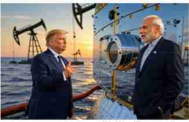
बाइजूट भारत तो लगातार रिकॉर्डस्तर पर तेल खरीदकर सबको चौंका रहा है।

बिलियन यूरो हो गया है। वहीं अगस्त में ही भारत ने रूस से लगातार तेल खरीदकर अमेरिका को मुहताब जवाब दे दिया। अगस्त में भारत ने रूस से 2.9 बिलियन यूरो यानी करीब साढ़े तीन अरब डॉलर का तेल खरीदा। ये चीन के 3.1 बिलियन यूरो यानी 3.84 अरब डॉलर के बहुत करीब है। एक रिपोर्ट के मुताबिक भारत का तेल आयात जुलाई में 2.7 बिलियन यूरो था। अगस्त में ये बढ़कर 2.9