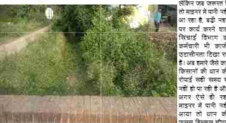
पर है क्योंकि इस समय बारिश भी नहीं हो रही है। सिंचाई विभाग के अधिकारी भी किसानों की

को किसान धान रोपित कर चुके हैं उनका धान सुखने के कारण समस्या पर बिल्कुल ध्यान नहीं दे रहे हैं जिससे माइनर में पानी कि जब जरूरत नहीं होती है लेकिन जब जरूरत है तो माइनर में पानी नहीं आ रहा है, बड़ी नहर पर कार्य करने वाले सिंचाई विभाग के कर्मचारी भी काफी उदासीनता दिखा रहे हैं। अब हमारे जैसे कई किसानों की धान की रोपाई सही समय से नहीं हो पा रही है और अगर ऐसे ही रहा माइनर में पानी नहीं आया तो धान की फसल बिल्कुल चीपट हो जाएगी। किसानों ने माइनर में पानी चालू करवाने की मांग किया है।