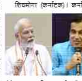
शिवमोगा (कर्नाटक)। कर्नाटक कांग्रेस के पिछाईयक बेलूर गोपालकृष्ण ने सत्तारूढ़ भाजपा के नेता और केंद्रीय मंत्री नितिन गडकरी को प्रधानमंत्री नरेंद्र मोदी का आदर्श उत्तराधिकारी बताया है। उन्होंने पीएम मोदी को 75 वर्ष की आयु में पद छोड़ने की सलाह

पीएम मोदी की रिवारमेंट के बाद गडकरी बनें देश के प्रधानमंत्री, कांग्रेस के इस नेता ने कर दी बड़ी मांग