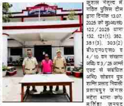
बहराइच को मुखबिर खास की सूचना पर समय 8:20 बजे हिरासत में लेकर किरदार करके जेल भेज दिया गया। गिरतार किए गए उपयुक्त के पास से 01 तमचा .12 बोर .02 जिन्दा कारतूस बरामद किया गया।