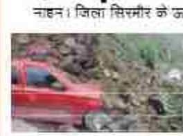
नाहन। जिला सिरमौर के जयरी क्षेत्र में देर रात को हुई भारी बारिश के चलते श्रीरंगुकाजी पिथानसमा क्षेत्र के हरिपुरघाट कस्बे के समीप हुए भारी भूस्खलन की चपेट में जाने से तीन वाहनों को भारी नुकसान पहुंचा है। गनीमत यह रही कि

हिमाचल के सिरमौर में भूस्खलन, कई गाड़ियां मलबे में दबीं