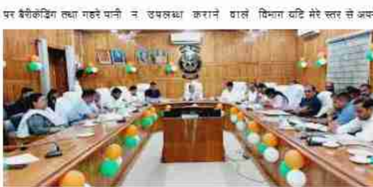
उपलब्ध कराने वाले विभाग यदि मेरे स्तर से अपने अधिकारियों पर डीएम ने कड़ी नजरकी ध्यान करते हुए अंतिम आदेशों तक धेन बाधित करने का निर्देश दिया। डीएम ने यह भी निर्देश दिया कि कोई भी विभागीय योजनाओं के सत्यापन के लिए आदेश कराता है और निर्धारित समय में सत्यापन आख्या प्राप्त नहीं होती है तो संबंधित विभाग द्वारा सत्यापनकर्ता