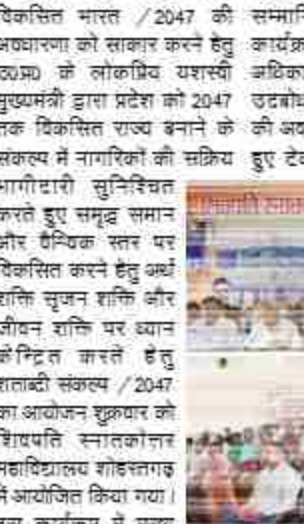
विकास के लक्ष्य पर चर्चा करते हुए

दैनिक बुद्ध का संदेश शोहरतगढ़/सिद्धार्थनगर। विकसित भारत /2047 की अवधारणा को साकार करने हेतु