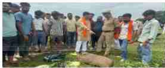
प्रभारी ने बताया कि बरामद मांस को जांच के लिए भेजा

दैनिक बुद्ध का संदेश सुनरियागंज/सिद्धार्थनगर। धाना क्षेत्र सुनरियागंज के बंदीला गांव में शुक्रवार को एक सटिथ बोरी में गौ मांस और पालिधन में पैक किया गया मांस भी बरामद हुआ। ग्रामीणों ने सटिथ बोरी टेंडरकर