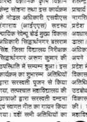
है। हालात यह है कि लोग घरों में रहने को मजबूर हैं। दैनिक मजदूरों और छोटे दुकानदारों को सबसे ज्यादा परेशानी हो रही है। बाजार बन्द होने से उनकी रोजी-रोटी प्रभावित हुई है। बाजार बन्द होने से उनकी रोजी-रोटी प्रभावित हुई है। बाजार बन्द होने से उनकी रोजी-रोटी प्रभावित हुई है।

दैनिक बुद्ध का संदेश बस्ती/सिद्धार्थनगर। नेपाल में जारी हिंसक विरोध प्रदर्शनों का प्रभाव भारत-नेपाल सीमा क्षेत्र में स्पष्ट रूप से दिखाई दे रहा है। कृष्णागंज की मुख्य बाजार पूरी तरह बंद है। यहाँ पहले भारत और नेपाल से हजारों खरीदार आते थे। अब पूरे इलाके में सन्नाटा