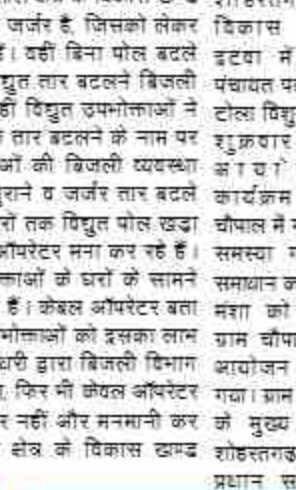
अधिकारियों से तुरंत फोन पर बात कर