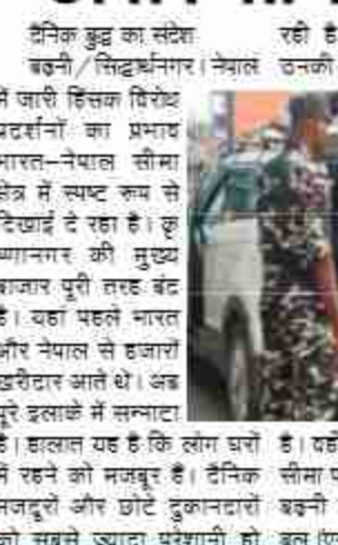
है। हालात यह है कि लोग घरों में रहने को मजबूर हैं। दैनिक मजदूरों और छोटे दुकानदारों को सबसे ज्यादा परेशानी हो रही है। बाजार बन्द होने से उनकी रोजी-रोटी प्रभावित हुई है। बाजार बन्द होने से उनकी रोजी-रोटी प्रभावित हुई है।

दैनिक बुद्ध का संदेश बस्ती/सिद्धार्थनगर। नेपाल में जारी हिंसक विरोध प्रदर्शनों का प्रभाव भारत-नेपाल सीमा क्षेत्र में स्पष्ट रूप से दिखाई दे रहा है। कृष्णागंज की मुख्य बाजार पूरी तरह बंद है। यहाँ पहले भारत और नेपाल से हजारों खरीदार आते थे। अब पूरे इलाके में सन्नाटा