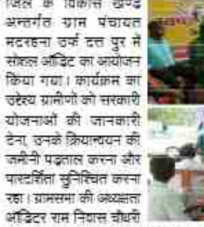
सहित सैकड़ों ग्रामीण उपस्थित