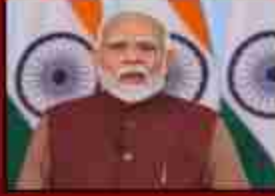
लोगों की सेवा करने का बहुत बड़ा संघ मिलता है। आप सभी को