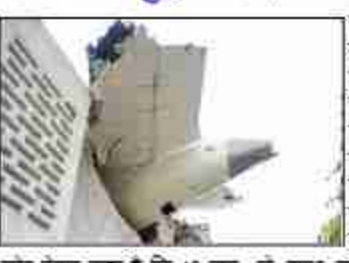
जोर देकर कहा है कि 12 जून को अहमदाबाद में हुए एयर इंडिया विमान हादसे की जाँच रिपोर्ट में केवल प्रारंभिक निष्कर्ष है। मुझे नहीं लगता कि हमें इस

नई दिल्ली। विमान दुर्घटना जांच ब्यूरो ने शनिवार आठ रात के कुछ ही घंटे बाद एयर इंडिया फ्लाइट 171 दुर्घटना की अपनी प्रारंभिक रिपोर्ट जारी की जाँच ब्यूरो ने एयर इंडिया B787-8 विमान दुर्घटना पर एक प्रारंभिक रिपोर्ट में कहा है कि जेट ड्रिवन रिचव रक्षक में 1 संकड़ के अंतराल पर बंद हो गए। एक पायलट को यह ज्ञात हुए सुना गया कि रस्ते में ड्रिवन बंद नहीं किया। नागरिक उड्डयन मंत्री किजरापु राम मोहन नायडू ने