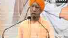
औरंगजेब जैसा क्रूर और बर्बर शासक था? उस काल में हर जगह अत्याचारों की खबरें आती थीं। औरंगजेब का उद्देश्य सनातन धर्म का उन्मूलन करना था। इस्लामीकरण के अपने ध्येयक अभियान में उसे पहली चुनौती गुरु तेग बहादुर महाराज से ही मिली। योगी आदित्यनाथ ने कहा कि हमने बलरामपुर में एक बड़ी जाँच शुरू की है। आपने देखा

उत्तर प्रदेश के मुख्यमंत्री योगी आदित्यनाथ ने गुरु तेग बहादुर जी के 350वें बलिदान दिवस के उपलक्ष्य में मुख्यमंत्री आवास पर यात्रा के उद्घाटन कार्यक्रम का आयोजन किया, जिसे नवंबर में मनया जाएगा। इस दौरान सीएम ने एक कार्यक्रम को भी संबोधित किया। योगी आदित्यनाथ ने कहा कि गुरु तेग बहादुर महाराज ने सनातन धर्म की रक्षा के लिए अपने प्राणों की आहुति दे दी। इस कार्यक्रम के माध्यम से उनकी यात्रा और 350 वर्षों के संपूर्ण इतिहास को जीवंत किया जा रहा है। योगी ने आगे कहा कि यह युग कैसा रहा होगा जब