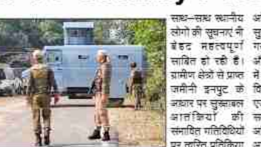
आतंकियों के छिपने के संभावित ठिकानों को घेरा जा सके। इसके अलावा, नाइट विजन ड्रिवाइस और अग्रिम तकनीकी उपकरणों की मदद से रात में तलाशी अभियानों को तेज किया गया है। हम आपको यह भी बता दें कि इस अभियान की सफलता में खुफिया एजेंसियों की भूमिका के

जम्मू-कश्मीर के पीर पंजाल पर्वतीय क्षेत्र और इसके दक्षिणी भागों में सुरक्षा बलों ने एक व्यापक और सुनिश्चित आतंकवाद-विरोधी अभियान शुरू कर रखा है। इस अभियान का उद्देश्य लगभग 40-50 आतंकवादियों का पता लगाना और उन्हें निष्क्रिय करना है, जो कि क्षेत्र में जैश-ए-मोहम्मद, लश्कर-ए-तैयबा जैसे प्रतिबंधित आतंकी संगठनों से जुड़े हैं। हम आपको बता दें कि उधमपुर, रियासी, डोडा और किश्तवाड़ जिलों में करीब 30 जैश-ए-मोहम्मद के आतंकवादी सक्रिय बताए जा रहे हैं। राजौरी और मुंठ जिलों में 15-20 अन्य आतंकी मौजूद हैं। खुफिया रिपोर्टों के अनुसार इन आतंकवादियों में से 80-85% पाकिस्तानी नागरिक हैं, जो घाटी में घुसपैठ कर छिपे हुए हैं। सुरक्षा बलों ने इन आतंकियों को पकड़ने और उनके ठिकानों को खत्म करने के लिए बहु-स्तरीय रणनीति अपनाई है। आतंकियों की गतिविधियों पर नजर रखने के लिए ड्रोन और निगरानी विमान तैनात किए गए हैं। इसके अलावा आतंकियों को सीमा पार से मिलने वाली हथियार और सामान की हवाई आपूर्ति को रोकने के लिए एटी-ड्रोन तकनीक सक्रिय की गई है। साथ ही उच्च दुर्गम पर्वतीय इलाकों में विशेष बलों की तैनाती की गई है, ताकि