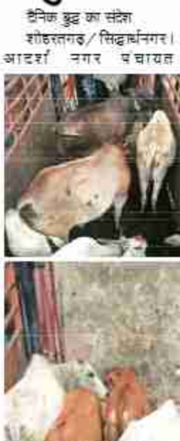
शोहरतगढ़ में विगत दिनों दौड़ रहे घोड़े की रस्ती में जंसकर एक किशोर गम्भीर घायल हो गया था, जिससे नगरवासियों में बहुत आक्रोश था। नगरवासियों का कहना है कि उक्त घटना से पशुओं के हमले