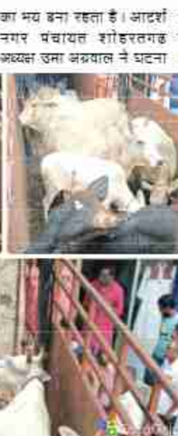
को गम्भीरता से लेते हुए बीते दिनों पालतू व बेसहारा पशुओं के खिलाफ धर-पकड़ अभियान चलाया। आदर्श नगर पंचायत शोहरतगढ़ में घूम रहे बेसहारा पशुओं को नगर पंचायत कार्रवाई द्वारा 45 पशुओं को