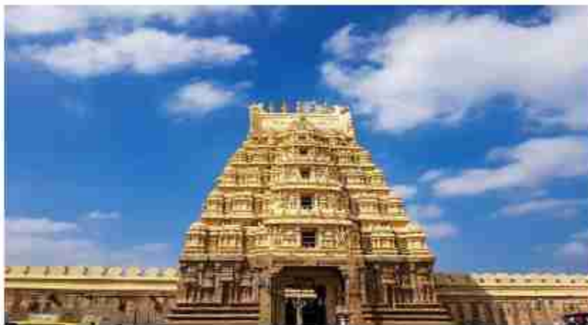
चन्नरायपेटा तालुक के चिक्कोनहल्ली गांध में चन्नरायपेटा पहुंचना होगा। जोकि रेल मार्ग और अमरागिरि श्री गुड्डा रंगनाथस्वामी मंदिर स्थित है। सड़क मार्ग से कनेक्ट है। वहीं अगर आप बंगलुरु से आ रहे हैं तो आपको करीब 180 किमी की दूरी तय करनी होगी। जिसको आप बस ट्रेन या फिर कार से 3-4 घंटे में तय कर सकते हैं। चन्नरायपेटा या हसन से आप टैक्सी या लोकल गाड़ी की मदद से चिक्कोनहल्ली पहुंच सकते हैं। मंदिर की कहानी: विदेशी आक्रमणकारियों से मंदिर की सुरक्षा के लिए गांध वाले इसको रंगनाथस्वामी मंदिर कहने लगे। क्योंकि यहां पर आक्रमणकारी रंगनाथ के नाम और पूजा का सम्मान करते थे। वहीं रामानुजाचार्य द्वारा बताए मुताबिक यह मंदिर रंगनाथस्वामी मंदिर के नाम से फेमस हो गया। वहीं शनिवार के दिन मंदिर में दसोहा का आयोजन होता है। राम नवमी पर रथ उत्सव मनाया जाता है। मंदिर के पुजारी के मुताबिक मंदिर की चुन्ना रदोनप्पार नामक एक देवता करते हैं। पत्थर की खासियत इस मंदिर की एक खास बात यह है कि यहां पर रामानुजाचार्य का एक छोटा पत्थर है, जिसको यह त्रिकोण की तरह उपयोग में लाते थे। अब मान्यता है कि यदि कोई अपनी

ऐसे पहुंचे मंदिर कर्नाटक के हसन जिले के इस मंदिर तक पहुंचने के लिए आपको हसन या