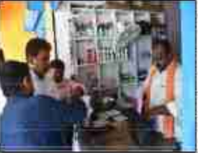
जिस पर जिलाधिकारी ने कड़ी नाराजगी व्यक्त करते हुए मौके पर दुकान सील कराया। जिला कृषि अधिकारी को निर्देश दिया कि सुसंगत धाराओं में एकआईआर दर्ज कराये।

मेसर्स कृष्ण मुरारी के वितरण रजिस्टर में 712 बोरी की जगह पर मात्र 151 बोरी मिला