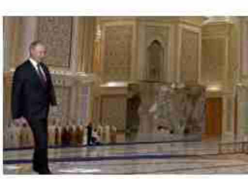
इसी अलास्का में पुतिन और ट्रंप आमने सामने होंगे। अलास्का को क्यों चुना गया? इस जगह को इसलिए चुना

रूस के राष्ट्रपति व्लादिमीर पुतिन शेर की तरह अमेरिका में घुसने वाले हैं। 15 अगस्त को जब भारत अपना स्वतंत्रता दिवस मना रहा होगा तो उस घण्टे पुतिन पूरे लाव लश्कर के साथ अलास्का में डोनाल्ड ट्रंप के साथ मुलाकात करने जा रहे हैं। जिससे यूक्रेन के साथ चल रही जंग का कोई समाधान निकाला जा सके। मगर इस बड़ी मुलाकात का सबसे बड़ा असर भारत पर पड़ेगा और भारत ने भी इस ऐतिहासिक मुलाकात से पहले अचानक पूरा खेल बदल दिया है। यूक्रेन और टैरिफ वॉर के बीच पुतिन और ट्रंप का आमना सामना अमेरिका के अलास्का में हो रहा है। अलास्का रूस से 88 किलोमीटर दूर है और अब अमेरिका का हिस्सा बन चुका है। 1741 में रूसी खोजकर्ताओं ने अलास्का की खोज की थी। उसी के बाद रूस ने अलास्का पर दावा कर दिया था। लेकिन 1799 में रूस के साथ-साथ अमेरिका ने भी अलास्का पहुंचकर वहां व्यापार शुरू कर दिया। लेकिन 1867 अंत आते रूस को अलास्का में व्यापारिक घाटा होना शुरू हो गया। जिसके कारण 1867 में 72 मिलियन डॉलर में अलास्का अमेरिका को बेच दिया। अब