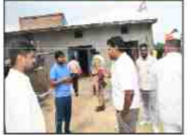
मौके पर दुकान सील कराया। जिला कृषि अधिकारी को निर्देश दिया कि सुसंगत धाराओं में एकआईआर दर्ज कराये।

मेसर्स जायसवाल के वितरण रजिस्टर में 701 बोरी की जगह पर मात्र 411 बोरी मिला