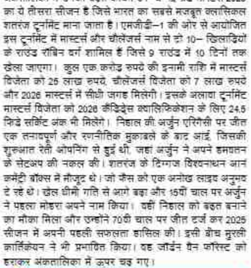
अंकातालिका में उनकी बड़त कायम है। चेन्नई ग्रैंड मास्टर्स 2025 का ये तीसरा सीजन है जिसे भारत का सबसे मजबूत क्लासिकल शतरंज टूर्नामेंट माना जाता है। एमजीडी-1 की ओर से आयोजित इस टूर्नामेंट में मास्टर्स और चैलेंजर्स नाम से दो 10- खिलाड़ियों के राउंड रॉबिन वर्ग शामिल हैं जिसे 9 राउंड में 10 दिनों तक खेला जाएगा। कुल एक करोड़ रुपये की इनामी राशि में मास्टर्स विजेता को 25 लाख रुपये, चैलेंजर्स विजेता को 7 लाख रुपये और 2026 मास्टर्स में सीधी जगह मिलेगी। इसके अलावा टूर्नामेंट मास्टर्स विजेता को 2028 ऑलिम्पिक्स क्वालिफिकेशन के लिए 24.5 किडे सिक्रेट अंक भी मिलेगा। निहाल की अर्जुन एरिगैसी पर जीत एक तनावपूर्ण और रणनीतिक मुकाबले के बाद आई, जिसकी शुरुआत रैती ओपनिंग से हुई थी, जहां अर्जुन ने अपने हमघतन के सेटअप की नकल की। शतरंज के दिग्गज विश्वनाथन आन कमेंट्री बॉक्स में मौजूद थे। जो कैसे को एक अनोख लाइव अनुभव दे रहे थे। खेल धीमी गति से आगे बढ़ा और 15वीं चाल पर अर्जुन ने पहला मोहरा अपने नाम किया। वहीं निहाल को बड़त बनाने का मौका मिला और उन्होंने 70वीं चाल पर जीत दर्ज कर 2025 सीजन में अपनी पहली सफलता हासिल की। इसी बीच मुरली कार्तिकेयन ने भी प्रभावित किया। यह जॉर्डन वैन फॉरस्ट को हराकर अंकातालिका में ऊपर चढ़ गए।

पहुंछे। जहां उन्होंने अपने फ्यूचर प्लान के बारे में बताया। उन्होंने कहा कि उनके पास बहुत समय है सोचने के लिए कि वह आईपीएल 2026 में खेलेंगे या नहीं। होस्ट से बातचीत करते हुए धोनी ने कहा कि, मुझे नहीं पता कि मैं खेलूंगा या नहीं। मेरे पास सोचने के लिए अभी बहुत समय है। दिग्गजों के पास कुछ समय बाकी है तो मैं कुछ मैचों में सींगुआ और फिर आखिरी फैसला लूंगा। इस बीच ऑडियंस में मौजूद एक फैन ने धोनी को कहा कि आपका खेलना होगा सर। जिस पर धोनी कहते हैं कि अरे घुटने में जो दर्द होता है उसका ख्याल जौन रहेगा।