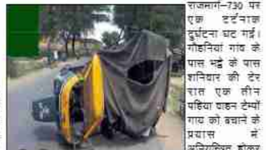
राजमार्ग-730 पर एक ट्रक का दुर्घटना घट गई। गौहनिया गांव के पास सड़क के पास शनिवार की देर रात एक तीन पहिया वाहन टेम्पों गांव को बचाने के प्रयास में अनियंत्रित होकर सड़क पर पलट गया। सड़क हाटसे में टेम्पों में कोई सवारी नहीं थी। लेकिन गांव गम्भीर रूप से घायल हो गई। स्थानीय लोगों ने तुरन्त मदद करते हुए घायल गांव को सड़क किनारे ले जाकर उसका उपचार कराया। घटना के बाद जब टेम्पों को सीधा किया गया, तो वहां भीड़ इकट्ठा होने लगी। इसे देखते हुए टेम्पों वालक चालाकी से वाहन लेकर मौके से फरार हो गया। स्थानीय लोगों का कहना है कि राष्ट्रीय राजमार्ग-730 पर सवैरियों के आवागमन से राहगीरों को परेशानी का सामना करना पड़ रहा है। इस तरह की घटनाएं आते-दिन हो रही हैं जिससे यात्रियों की सुस्ता खतरे में पड़ रही है।

दैनिक बुद्ध का संदेश शोहरतगढ़/सिद्धार्थनगर। धाना क्षेत्र विलिखिया अंतर्गत राष्ट्रीय