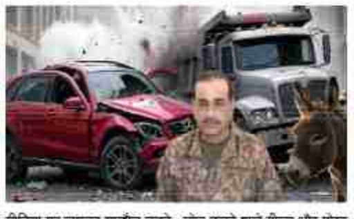
मीडिया पर जनकर मारशल उठने लगा। यूजर्स ने मजाक उड़ाते हुए कहा कि डंप ट्रक मर्सिडीज के पास पहुंचने से पहले ही रुक जाएगा या पलट जाएगा। सोशल मीडिया पर पाकिस्तानी सेना को

पाकिस्तानी सेना प्रमुख फीरुज मारशल आसिम मुनीर, पलायन के टैम्पा में एक पाकिस्तानी सामुदायिक कार्यक्रम के दौरान भारत की तुलना चमकती मर्सिडीज और पाकिस्तान की तुलना डंप ट्रक से करने पर सोशल मीडिया पर टोल हो रहे हैं। मुनीर अपने देश को एक कठोर लेकिन जयादा शक्तिशाली मर्सेडीस के रूप में पेश करने की कोशिश कर रहे थे, लेकिन उनकी तुलना का हिकल्प उलटा पड़ गया। मुनीर मर्सिडीज बनाम डंप ट्रक तुलना डंप ट्रिंट की एक रिवॉर्ट के अनुसार मुनीर ने कहा कि मैं इस स्थिति को समझाने के लिए एक साधारण उदाहरण का इस्तेमाल करूंगा। भारत एक चमकती मर्सिडीज है जो फेरारी की तरह हाईपे पर आ रही है, लेकिन हम बजरी से भरे एक डंप ट्रक हैं। अगर ट्रक कार से टकरा जाए, तो नुकसान किसका होगा? पाकिस्तानी सेना प्रमुख ने यह टिप्पणी मर्सिडीज के टैम्पा में पाकिस्तानी प्रवासियों को संबोधित करते हुए की। यह इस समय अमेरिका की यात्रा पर है। भारत-पाक तुलना के लिए आसिम मुनीर हुए ट्रेल मुनीर द्वारा अपनी टिप्पणी को अशुभ तुलना बताने पर सोशल