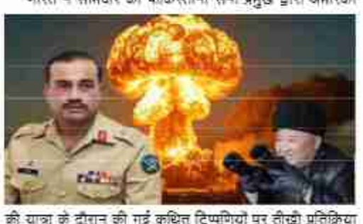
की यात्रा के दौरान की गई कथित टिप्पणियों पर लीखी प्रतिक्रिया व्यक्त की और इसे पाकिस्तान की परमाणु शक्ति की धांधली का उदाहरण बताया। विदेश मंत्रालय (एमईए) ने एक बयान में कहा कि इस तरह की टिप्पणियां पाकिस्तान की परमाणु कमान और नियंत्रण की अखंडता पर संदेह को रेखांकित करती हैं, खासकर ऐसे देश में जहां सेना आतंकवादी समूहों के साथ मिली हुई है। मंत्रालय ने इसे धक्कासोसजनक बताया कि ये टिप्पणियां एक मित्र शीसरे देश की धरती से की गईं। भारत के रुख को दोहराते हुए, विदेश मंत्रालय ने कहा कि देश परमाणु ब्लैकमेल के आगे नहीं झुकेगा और राष्ट्रीय सुरक्षा की रक्षा के लिए सभी आवश्यक कदम उठाएगा। भारत का पूरा बयान हमारा ध्यान पाकिस्तानी सेना प्रमुख द्वारा अमेरिका की यात्रा के दौरान कथित तौर पर की गई टिप्पणियों की ओर आकर्षित हुआ है। परमाणु हथियारों की धमकी पाकिस्तान की आदत है। अंतरराष्ट्रीय समुदाय ऐसी टिप्पणियों में निहित गैर-जिम्मेदारी पर अपने निष्कर्ष निकाल सकता है, जो ऐसे देश में परमाणु कमान और नियंत्रण की अखंडता पर गहरी शकंओं को भी पुष्ट करती हैं जहां सेना आतंकवादी समूहों के साथ मिली हुई है। यह भी खंडजनक है कि ये टिप्पणियां किसी मित्र देश की धरती से की गईं हैं। भारत पहले ही स्पष्ट कर चुका है कि वह परमाणु ब्लैकमेल के आगे नहीं झुकेगा। हम अपनी राष्ट्रीय सुरक्षा की रक्षा के लिए सभी आवश्यक कदम उठाते रहेंगे।