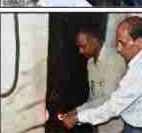
जिस पर जिलाधिकारी ने कड़ी नाराजगी व्यक्त करते हुए मौके पर दुकान सील कराया। जिला कृषि अधिकारी को निर्देश दिया कि सुसंगत धाराओं में एकआईआर दर्ज कराये।