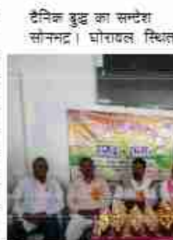
वीएमश्री राजकीय इंटर कॉलेज में 21 दिवसीय समर कैम्प का समापन समारोह मंगलवार को संपन्न हो गया। शासन के निर्देश पर 21 मई से 10 जून तक चले समर कैम्प में योग, व्यायाम, आसन, प्राणायाम और अन्य विभिन्न प्रकार की खेल गतिविधियों का आयोजन कराया गया। छात्र छात्राओं को नृत्य, संगीत, मिट्टी के बर्तनों को बनाना, कगज से सिफाका तैयार करना