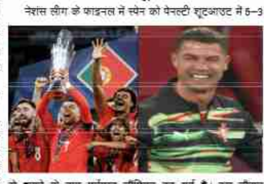
से हराया के बाद पुर्तगाल चैंपियन बन गई है। इस दौरान क्रिस्टियानो रोनाल्डो भावुक हो गए और मैदान पर अपने आंसूओं को रोक नहीं पाए। इससे पहले मैच समय और इसके बाद मिलने वाले अतिरिक्त समय के खत्म होने तक स्कोर 2-2 से बराबर था।

नेशंस लीग के फाइनल में स्पेन को पेनल्टी शूटआउट में 5-3 से हराया। क्रिस्टियानो रोनाल्डो भावुक हो गए और मैदान पर अपने आंसूओं को रोक नहीं पाए। इससे पहले मैच समय और इसके बाद मिलने वाले अतिरिक्त समय के खत्म होने तक स्कोर 2-2 से बराबर था। अलायंस अरेना स्टेडियम में पुर्तगाल और स्पेन के बीच नेशंस लीग का फाइनल मैच खेला गया। 21वें मिनट में स्पेन के लिए मार्टिन जुबीमेंडी ने पहला गोल टांगा। 5 मिनट बाद ही पुर्तगाल के जुनो मेंडेस ने गोल मारकर स्कोर 1-1 से बराबर किया। वहीं 45वें मिनट में निकोल ने गोल करके स्पेन को 2-1 से बढ़त दिला दी। इसके बाद पुर्तगाल ने एक गोल टांगा लेकिन रोनाल्डो ऑफ साइड में खड़े थे तो वे गोल अमान्य करार दिया गया। हालांकि, 61वें मिनट में रोनाल्डो ने ही शानदार गोल दागकर स्कोर को 2-2 से बराबर किया। रोनाल्डो के गोल के बाद मैच समय पर खत्म होने तक कोई गोल नहीं हुआ, इसके बाद अतिरिक्त समय मिला लेकिन यहाँ भी कोई गोल नहीं हुआ। इसके बाद पेनल्टी शूटआउट हुआ। इसमें पुर्तगाल ने स्पेन को 5-3 से हराया। जैसे ही पुर्तगाल जीती रोनाल्डो खुशी से भावुक हो गए। वह पहले टेस्टिवियम में बैठ गए जमीन पर सिर झुकाया और जब खड़े हुए तो उनकी आंखों में आंसू थे।