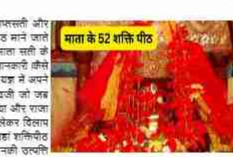
माता के 52 शक्ति पीठ

विरजा- विमला विरजाक्षेत्र जगन्नाथ पुरी देवी भागवत पुराण में 108, कालिकापुराण में 26, शिवचरित्र में 51, दुर्गा शक्तिली और तंत्रचूडामणि में शक्ति पीठों की संख्या 52 बताई गई है। साधारणतः 51 शक्ति पीठ माने जाते हैं। तंत्रचूडामणि में लगभग 52 शक्ति पीठों के बारे में बताया गया है। प्रस्तुत है माता सती के शक्तिपीठों में इस बार विरजा- विमला विरजाक्षेत्र जगन्नाथ पुरी शक्तिपीठ के बारे में जानकारों जैसे बने ये शक्तिपीठ क जब महादेव शिवजी की पत्नी सती अपने पिता राजा दंड के यज्ञ में अपने पति का अपमान सहन नहीं कर पाई तो उसी यज्ञ में कूटकर मरस हो गईं। शिवजी जो जब यह पता चला तो उन्होंने अपने गण वीरभद्र को भेजकर यज्ञ स्थल को उजाड़ दिया और राजा दंड का सिर काट दिया। बाद में शिवजी अपनी पत्नी सती की जलौ हुई लाश लेकर विलाप करते हुए सभी ओर घूमते रहे। जहां-जहां माता के अंग और आभूषण गिरे वहां-वहां शक्तिपीठ निर्मित हो गए। हालांकि पौराणिक आख्यायिका के अनुसार देवी देव के अंगों से इनकी उत्पत्ति हुई, जो भगवान विष्णु के चक्र से सिद्धिन्म होकर 108 स्थलों पर गिरे थे, जिनमें में 51 का खास महत्व है।