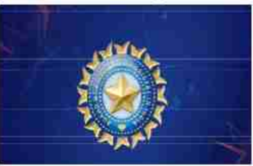
मुकाबला पहले दिल्ली में होना था लेकिन इस टेस्ट को कोलकाता शिफ्ट कर दिया गया

जाते हैं। टेस्ट सीरीज का पहला है। वे मुकाबला 14 से 18 नवंबर में होगा। बीसीसीआई ने वेन्यू में बदलाव की कोई बजह तो नहीं बताई है लेकिन कहा जा रहा है कि दिल्ली में नवंबर के मध्य से ठंड शुरू हो जाती है और प्रदूषण के कारण धुंध या कोहरा बनने लगता है और इससे एयर कंडीशनिंग बंद जाता है जिससे विजिबिलिटी भी कम हो जाती है। पहले भी कई बार ऐसा हो चुका है। शायद इसे देखते हुए ही बीसीसीआई ने वेन्यू में बदलाव किए हैं। घनडे और टी20 में कोई बदलाव नहीं साउथ अफ्रीका के खिलाफ तीन घनडे और 5 टी20