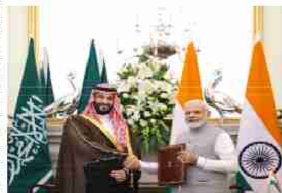
पर रोक लगाने के कदम से विदेशी कर्मचारियों की नर्ती पर काफी प्रभाव पड़ने की उन्मीद है। अरब टाइम्स की रिपोर्ट में कहा गया कि ब्लॉक वर्क वीजा

पूर्व-स्वीकृत कोटा है जो सऊदी कंपनियों को एक निश्चित संख्या के लिए प्रवेश वीजा के लिए आवेदन कर सकती है। इसे अन्न किंगडम के अन्न प्रबंधन पोर्टल किया से हटा दिया गया है। हालांकि, सूचीबद्ध देशों के अतिक्रमण करने वाली फर्मों को अस्थायी प्रतिबंध के तहत नए कोटा नहीं दिए जाएंगे, और पहले से स्वीकृत कोटा की प्रक्रिया में देरी हो सकती है। स्विकृत कार्य प्रवेश वीजा के लिए आवेदन स्थिति या अस्थाई वीजा दिए जा सकते हैं, तथा वैध कार्य वीजा वाले वे लोग जो अतीत सऊदी अरब नहीं पहुंचे हैं उन्हें प्रवेश प्रतिबंधों का सामना करना पड़ सकता है।