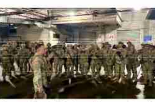
संभाल पा रहे ठीक वैसे ही जैसे जनपरी में लगी जानलेवा आग के दौरान हुआ था। नेशनल गार्ड को आमतौर पर स्थानीय प्रशासन को विश्वास में लेकर ब्रेक कठिन

अमेरिका का दूसरा सबसे बड़ा शहर लॉस एंजेलिस सड़कों पर उमड़ी भीड़ का उग्र प्रदर्शन, हाथ में मैक्सिकन झंडे जबरदस्त तोड़फोड़ और अत्याचार हांती पुलिस की गाड़ियों। तस्वीरें बता रही हैं कि हालात गूह युद्ध जैसे हैं। लॉस एंजेलिस के डिस्ट्रिक्ट सेंटर के बाहर प्रदर्शनकारियों ने ट्रंप सरकार के खिलाफ धारा बोला। उसके बाद पिछले दो दिनों में हालात बट से बदतर हो गए हैं। अब सेना और प्रदर्शनकारी आमने सामने हो चुके हैं। प्रदर्शनकारियों पर आंसू गैस के गोले छोड़े गए हैं। लोग गिरफ्तारी की नीतियों का विरोध कर रहे हैं। खर्द प्रदर्शनकारियों के हाथ में मैक्सिकन झंडे तक दिखाई पड़े। पुलिस और सेना के सामने ही प्रदर्शनकारी गाड़ियों को पकू रहे हैं। ट्रंप ने कहा- दंगाइयों को कुचल दूंगा। ट्रंप ने सोशल साइट रटूथ सोशलशर पर पोस्ट कर नेशनल गार्ड को बेहतरीन काम के लिए बर्बाद टी और कहा कि दंगाइयों को हन कुचल देंगे। ट्रंप ने अपने पोस्ट में नैचर कैरेन बैस और गवर्नर न्यूसन पर तंज करते हुए कहा कि वे हालात नहीं संभाल पा रहे ठीक वैसे ही जैसे जनपरी में लगी जानलेवा आग के दौरान हुआ था। नेशनल गार्ड को आमतौर पर स्थानीय प्रशासन को विश्वास में लेकर ब्रेक कठिन