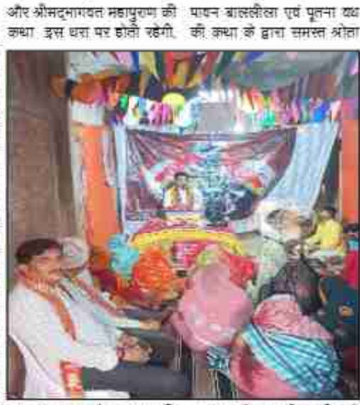
तब तक अमन चीन, सुख शांति एवं समृद्धि बनी रहेगी। महाराज जी ने परब्रह्म भगवान् श्री ध्वज के