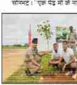
दैनिक बुद्ध का सन्देश सोनमठ। एक पेड़ मां के नाम अभियान 20 के तहत बुधवार को पुलिस अधीक्षक