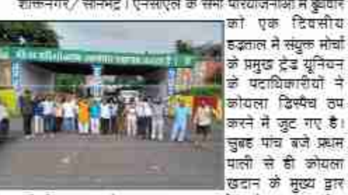
हड़ताल में संयुक्त मोर्चा के प्रमुख टैड युनिचन के पदाधिकारियों ने कोयला डिस्पैच ठप करने में जुट गए हैं।

दैनिक बुद्ध का सन्देश राकिनगर/सोनमठ। एनसीएल के सभी परियोजनाओं में बुधवार को एक दिवसीय