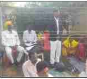
दबंगों से परेशान आदिवासियों ने बैठक कर आवश्यक रणनीति बनाई