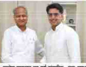
राजेश पायलट का पूर्व संसदीय क्षेत्र था। राजस्थान कांग्रेस नेतृत्व को लेकर उनके तीखे सत्ता संघर्ष के बाद जिसके कारण 2020 में एक बड़ा राजनीतिक संकट पैदा हो गया था, वर्षों में दोनों नेताओं के बीच यह पहली सार्वजनिक बातचीत है। गहलोत ने एक्स

जयपुर। एक महत्वपूर्ण समारोह में आमंत्रित किया जो पर पोस्ट किया कि पूर्व केंद्रीय मंत्री स्वर्गीय श्री राजेश पायलट की 25वीं पुण्यतिथि पर उनके आवास पर आयोजित कार्यक्रम में एआईसीसी महासचिव सचिन पायलट को आमंत्रित किया गया। राजेश पायलट और सचिन पायलट ने 1980 में पहली बार एक साथ लोकसभा पहुंचे और लगभग 18 वर्षों तक एक साथ सांसद रहे। उनके आकस्मिक नियुक्त हुए अभी भी दुखी हैं। उनका जाना पार्टी के लिए भी एक बड़ा झटका था। उन्होंने दोनों की मुलाकात का एक वीडियो भी शेयर किया।