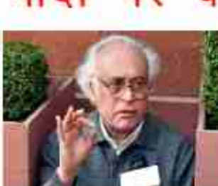
बिना एडिटिंग, बिना रिफ्लेक्ट वाली एक भी असली प्रेस मीटिंग करने का साहस नहीं दिखाया। उन्होंने कहा कि यह उनके पूर्व प्रधानमंत्रियों से बिल्कुल उलट है।

हर देश का शासनाध्यक्ष समय-समय पर प्रेस कॉन्फ्रेंस करते हैं। लेकिन हमारे प्रधानमंत्री को प्रेस के सीधे सवाल का सामना किए हुए 11 साल हो चुके हैं। पिछले सात चुनाव प्रचार के दौरान श्री नरेंद्र मोदी ने मीडिया इंटरव्यू के एक शो की तरह प्रोड्यूस, डायरेक्ट और रिफ्लेक्ट किया - जिसमें उन्होंने खुद को 'नैन-बयोलॉजिकल' बताने वाला चर्चित दावा भी किया था। लेकिन अब तक उन्होंने कभी भी