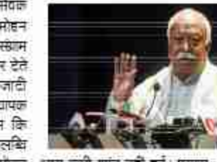
आग जमी शांत नहीं हुई। प्रयास जारी रहे और सभी के सामूहिक प्रयासों से ही आजादी मिली।

नागपुर। राष्ट्रीय स्वयंसेवक संघ (आरएसएस) प्रमुख मोहन भागवत ने भारत के स्वतंत्रता संग्राम की सामूहिक प्रकृति पर जोर देते हुए कहा कि देश की आजादी 1887 के विद्रोह से शुरू हुए व्यापक प्रयासों का परिणाम थी, न कि किसी एक व्यक्ति की उपस्थिति थी। नागपुर में एक पुस्तक विमोचन समारोह को मुख्य अतिथि के रूप में संबोधित करते हुए भागवत ने कहा कि हमारा इस बात पर बहस होती है कि देश को आजादी किसके प्रयासों से मिली। लेकिन वास्तविकता यह है कि यह आजादी किसी एक व्यक्ति के कारण नहीं मिली। इसके लिए प्रयास 1857 में शुरू हुए और हर जगह आग भड़क उठीय उसके बाद यह