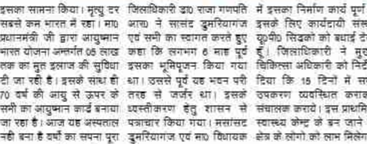
सांसद जगदम्बिका पाल ने किया प्राथमिक स्वास्थ्य केन्द्र नौगढ़ के नये भवन का उद्घाटन