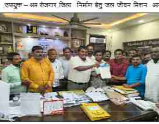
विकास अधिकारी के साथ प्रधान संगठन की बैठक सुनिश्चित कराया जाए। जिन ग्राम पंचायत के अन्तर्गत पानी की टंकी के