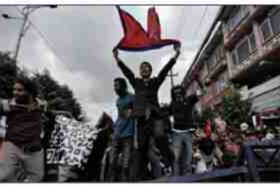
संसद के सुझावकारियों पर पधाराप किया। प्रदर्शनकारियों को तितर-बितर करवा दिया गया है।

नई दिल्ली। श्रीलंका और बांग्लादेश के बाद अब नेपाल में भी युवा सरकार के खिलाफ बग़ावत पर उतर आए। इंटरनेट मीडिया पर प्रतिबंध लगाने और देश में व्याप्त भ्रष्टाचार के विरोध में जेन-जी के बैनर तले हजारों युवाओं ने राजधानी काठमांडू और विभिन्न शहरों में हिंसक प्रदर्शन किए हैं। प्रदर्शनकारियों में सैकड़ों छात्र स्कूल व कॉलेज की युनिफ़ॉर्म में देखे गए। हिंसा पर उतारूक प्रदर्शनकारियों के खिलाफ सुरक्षा बलों की कार्रवाई में 12 साल के स्कूली बच्चे समेत कम से कम 19 लोगों की मौत हो गई जबकि लगभग 350 घायल हैं। काठमांडू में कर्फ्यू के साथ ही सेना तैनात कर दी गई है। कई अन्य शहरों में भी कर्फ्यू लगाया गया है। प्रधानमंत्री कपी शर्मा ओली ने कैबिनेट की आपात बैठक बुलाकर हालात पर विचार-विमर्श किया। संसद के सुझावकारियों पर पधाराप किया। प्रत्यक्षदर्शियों के अनुसार, प्रदर्शन उस समय हिंसक हो गया जब कुछ प्रदर्शनकारी बैरिकेड्स तोड़कर संसद परिसर में घुस गए। एंबुलेंस को आग