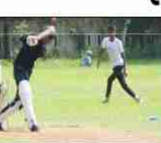
नवन बैडमिंटन हॉल और बास्केटबॉल कोर्ट की मरम्मत भी होगी। इसके लिए 16.54 करोड़ की शासन स्तर पर स्वीति की लगभग तैयारी पूरी कर ली गई है। इसके लिए लखनऊ में 25 अगस्त को प्रमुख सचिप की अध्यक्षता में बैठक भी हो चुकी है। अब तक जिला स्पोर्ट्स स्टेडियम में सुविधाओं के न होने से खिलाड़ियों को परेशानी होती थी। स्टेडियम में जिन कामों की स्वीति मिली है। उसमें प्रमुख

दैनिक बुद्ध का संदेश सिद्धार्थनगर। खेल और खिलाड़ियों को बढ़ावा देने के लिए संचालित जिला स्पोर्ट्स स्टेडियम जल्द ही कार्याकल्प होगा। इससे खिलाड़ियों को बेहतर प्रशिक्षण के साथ कई प्रमुख सुविधा भी मिलने लगेगी। नई व्यवस्था से खिलाड़ी को नेशनल व इन्टरनेशनल खेल का भी अनुभव प्राप्त होगा। इसके लिए 16.54 करोड़ रुपये खर्च किये जायेंगे स्टेडियम स्थिति टिकट के निर्माण की स्वीति मिली है। इसके साथ ही प्रशासनिक