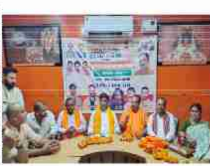
माल्यायण का कार्यक्रम करेगे। उन्होंने कहा कि 14 अगस्त को पार्टी की ओर से विभाजन

दैनिक बुद्ध का संदेश बलरामपुर। हर घर तिरंगा अभियान को लेकर शुक्रवार को भाजपा की ओर से नगर स्थित नगरपालिका सभागार में नगर कार्य योजना बैठक की गई। बैठक में तिरंगा धारा को लेकर भाजपा कार्यकर्ताओं को जिम्मेदारी सौंप गई। कार्यक्रम के मुख्य अतिथि नगर प्रभारी दुष्मन्त वर्मा रहे। उन्होंने कहा कि औपवेशन सिंदूर के बाद प्रधानमंत्री नरेंद्र मोदी ने 18 अगस्त को हर घर तिरंगा लगाने का आह्वान किया है। भाजपा की ओर से जिले में