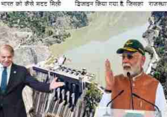
भारत को कैसे मदद मिली डिजाइन किया गया है, जिसका राजस्थान जैसे राज्यों को लाभ मिलने की उम्मीद है। सरकार ने कहा है कि काम तेजी से आगे बढ़ रहा है और दो से तीन साल में पूरा होने की उम्मीद है। एक विस्तृत परिव्योजना रिपोर्ट (डीपीआर) भी तैयार की जा रही है। पाकिस्तान के लिए इसका क्या मतलब है। सुनाओ का सुझाव है कि संधि के निलंबन से पाकिस्तान की रबी फसलों पर काफी असर पड़ सकता है, जबकि खरीफ सीजन अपेक्षाकृत अप्रभावित रहेगा। कृषि के अलावा, व्यवधान दैनिक जीवन को प्रभावित कर सकता है, जिससे संभावित रूप से जल