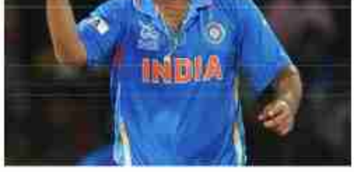
43 विकेट बटकाए थे। वो 15 साल से टीम इंडिया के बाहर थे और उन्होंने आखिरी मैच भारत का प्रतिनिधित्व टी20 प्रारूप में इंग्लैंड के खिलाफ 2012 में वानखेड़े स्टेडियम में किया था। पीयूष चावला दो वर्ल्ड कप विनर टीम का हिस्सा रह चुके हैं। साल 2007 में जब धोनी ने पहली बार टी20 वर्ल्ड कप खिताब जीता था उसमें वो भारतीय टीम का हिस्सा थे जबकि 2011 वर्ल्ड कप में भी वो टीम इंडिया का हिस्सा थे। वो दोनों बार टीम इंडिया का हिस्सा जरूर थे लेकिन उन्हें खेलने का मौका नहीं मिल पाया था। पीयूष चावला ने भारत के लिए 9 मार्च 2006 को मोहाली में इंग्लैंड के खिलाफ टेस्ट डेब्यू किया था जबकि वनडे में उनका डेब्यू साल 12 मई 2007 को बंगलादेश का खिलाफ हुआ था। टी20 में डेब्यू के लिए उन्हें धोधा ब्रतजगर करिना पट्टा था लेकिन साल 2010 में 2 मई को वो साउथ अफ्रीका के खिलाफ क्रिकेट के सबसे छोटे प्रारूप में पदार्पण करने में सफल रहे थे।