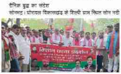
दैनिक बुद्ध का संदेश

सोनमठ। घोरावल विकासखंड के शिल्पी ग्राम स्थित सोन नदी