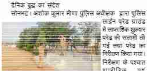
दैनिक बुद्ध का संदेश