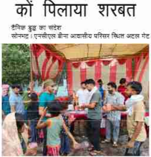
दैनिक बुद्ध का संदेश

बनाएँ। उन्होंने निर्देश दिया कि में आयोजित होने वाले बृहद हेतु जिला पंचायत राज अधिकारी, अधिशाही अधिकारी नगर पालिका, जिला क्रीडाधिकारी, मुख्य चिकित्साधिकारी, जिला विद्यालय निरीक्षक, जिला बैरिक शिक्षा अधिकारी, जिला युवा कल्याण अधिकारी, जिला कार्यक्रम अधिकारी सहित अन्य सम्बंधित अधिकारियों को योगाभ्यास स्थल पर आवश्यक व्यवस्थाएं सुनिश्चित कराने हेतु निर्देशित करते हुए कहा कि योग साधकों, विशिष्ट अतिथियों, महिलाअर्थी बच्चों के बैठने की उचित व्यवस्था सुनिश्चित की जाए। वहीं कोई व्यवस्था नहीं है। जिलाधिकारी ने अधिशाही अधिकारी नगर पालिका को निर्देश दिए कि कार्यक्रम स्थलों पर साफ-सफाई दुरुस्त किया जाए। शौचालयों की व्यवस्था होनी चाहिए पीने के पानी की भी व्यवस्था कार्यक्रम स्थल पर कराए जाने के निर्देश दिये गये। उल्लेखनीय