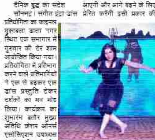
दैनिक बुद्ध का संदेश

प्रतियोगिता में प्रतिभाग करने वाले बच्चों को दिया गया पुरस्कार