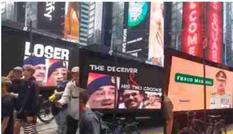
अली जरदारी और पूर्व प्रधानमंत्री नवाज शरीफ को दो बदमाशों के रूप में चित्रित किया गया है। इस घटना को पाकिस्तान में हाल ही में हार के