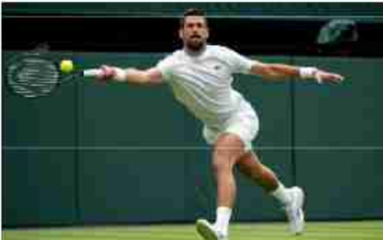
और दुनिया के छठे नंबर के टेनिस खिलाड़ी नोवाक जोकोविच ने सिनसिनाटी ओपन से नाम वापस ले लिया है। टूर्नामेंट के आयोजकों ने इसकी पुष्टि की है। दरअसल 38 वर्षीय सर्बियाई खिलाड़ी ने गैर-चिकित्सीय कारणों का हवाला देते हुए टूर्नामेंट में न खेलेने का फैसला

24 रैंड स्लैम खिताब विजेता किया है। इससे पहले उन्होंने जीत दर्ज की थी। वह मुकाबला तीन सेटों में खेला गया था। इस सीजन में नोवाक जोकोविच का प्रदर्शन 28 जीत और 9 हार का रहा है। उन्होंने मई 2025 में जिनेवा में अपना 100वां टूर-स्तरीय खिताब जीता था। उस जीत के बाद से वह केवल दो टूर्नामेंट खेले हैं प्रॉच ओपन और विंबडलन, जहां दोनों बार उन्हें जैविक सिनर के खिलाफ सेमीफाइनल में