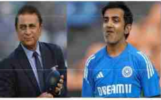
होती हैं। असल में अगर आप देश के लिए खेल रहे हैं तो टर्ट या थका जैसी चीजें माफने नहीं रखती। वो लगातार 5 टेस्ट खेलें 8-7 ओवर के स्पेल जैसे क्योंकि कप्तान को जरूरत थी

बाते सिर्फ मानसिक स्तर की और देश को उनसे उम्मीद थी। कभी बॉर्डर पर जवान को ठंडा या टर्ट की शिकायत करते सुना है? वो असली जान देने के लिए खड़े रहते हैं। वैसे ही जब आप भारत के लिए खेल रहे हैं तो चोटें और थकानें छोटी बात हैं। ये गर्व की बात है कि आप 140 करोड़ लोगों में से देश का प्रतिनिधित्व कर रहे हैं। हालांकि, गावस्कर ने ये भी साफ किया कि उनका ये बयान जसप्रित बुमराह के लिए नहीं था। बुमराह को इंग्लैंड टोरे पर दो मैचों से अलग दिया गया था, लेकिन वह किसी वर्कलोड रोटेसन के कारण नहीं बल्कि पुरानी चोट से उबरने के कारण से था।