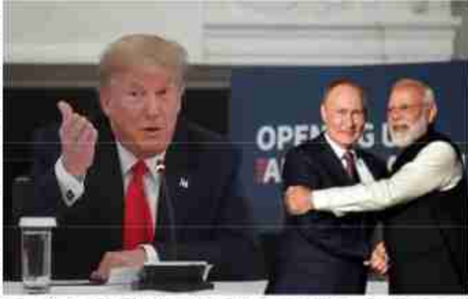
से दोनों देशों में तनाव और ब्रह्म संरक्षण ने कहा अब रूस बहुत इंटरमीडिएट-रेंज बैलिस्टिक

शॉर्टर-रेंज मिसाइलों की तैनाती पर लगाई गई रोक को हटाने का एलान कर दिया है। यह फैसला अमेरिका द्वारा अपने दो यू.एस. विलियम र. सभमरोस को रूसी तटों के कयास ये लगाए जाने लगे हैं कि क्या रूस और अमेरिका के बीच सीधे जंग शुरू हो जाएगी? ट. र. अ. स. ल. अमेरिका ने रूस के पास अपने परमाणु प्रतियुद्धियों को तैनात कर दिया