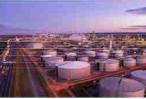
कीमतों पर होंगे। यह परिदृश्य भारत की ऊर्जा सुरक्षा के लिए खतरे का कारण बन सकता है, क्योंकि देश अपनी ऊर्जा आवश्यकताओं को अंतर्राष्ट्रीय कूटनीतिक रिश्तों के साथ संतुलित करने की कोशिश कर रहा है। आर्थिक परिणाम उच्च शुल्कों के कारण भारत में उपभोक्ताओं और व्यवसायों के लिए ईंधन की कीमतें बढ़ सकती हैं, जिससे मुद्रास्फीति का दबाव बढ़ सकता है।

ऊर्जा स्रोतों को विशिष्टीकरण इस प्रभाव को कम करने के लिए भारत को अपने ऊर्जा स्रोतों के विविधीकरण की दिशा में तेजी से कदम उठाने की आवश्यकता हो सकती है, जिसमें अन्य तेल उत्पादक देशों के साथ साझेदारी करना या नवीकरणीय ऊर्जा में निवेश करना शामिल हो सकता है। भू-राजनीतिक परिणाम भारत के लिए अमेरिका और रूस दोनों के साथ रिश्ते तनावपूर्ण हो सकते हैं, जिससे अंतर्राष्ट्रीय व्यापार और कूटनीति में इसकी रणनीतिक स्थिति प्रभावित हो सकती है। जैसे-जैसे ट्रंप की शुल्क धमकियां सामने आ रही हैं, भारत एक महत्वपूर्ण मोड़ पर खड़ा है, जहाँ उसे अंतर्राष्ट्रीय व्यापार की जटिलताओं को समझते हुए अपनी ऊर्जा सुरक्षा सुनिश्चित करना है। इन घटनाओं में महत्वपूर्ण भाग। इन शुल्कों के आसपास हो रहे घटनाक्रमों पर नजर रखना विश्वव्यापी और नीति निर्माताओं के लिए जरूरी होगा।