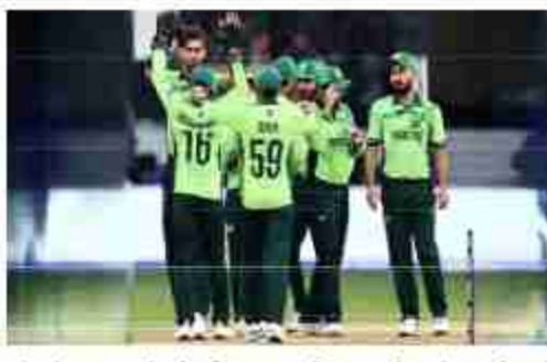
को लेकर उसके ही दिग्गज सवाल उठने लगे हैं। इसी कड़ी में हाल ही में पाकिस्तान के पूर्व कप्तान राशद लतीफ ने टीम को लेकर सवाल खड़े किए हैं। लतीफ ने एशिया कप से पहले भारत के खिलाफ पाकिस्तान की संभावनाओं को लेकर चिंता जताई। उन्होंने खराब प्रदर्शन का हवाला देते हुए कहा कि टीम की रणनीति में सुधार की

हमारी क्रिकेट हवा में चल रही है... पाकिस्तान के पूर्व कप्तान ने अपनी ही टीम को लताड़ा एशिया कप जैसे बड़े टूर्नामेंट से पहले पाकिस्तान क्रिकेट टीम जरूरत है। दरअसल, राशद लतीफ का ये बयान हाल ही में खिल्लाफ खेलना मुश्किल होगा। एशिया कप हो जाए बस। बता दें कि पहलगाव पर हुए आतंकी हमले के बाद भारत और पाकिस्तान के बीच तनाव बना हुआ है। इस कारण से भारत पाकिस्तान के साथ क्रिकेट मैदान पर भी मैच नहीं खेलना चाहता है। हाल ही में वर्ल्ड लीजेंड्स ऑफ क्रिकेट के सेमीफाइनल मैच जो भारत को पाकिस्तान के खिलाफ खेलना था। उसे बहिष्कार कर दिया था। ऐसे में 14 सितंबर को खेल जाने वाले भारत-पाक मैच पर भी संकट मंडा रहा है। वहीं राशद लतीफ ने खुज एजेंसी एनआइएस से बात करते हुए कहा कि हमारी क्रिकेट इस समय हवा में चल रही है, कोई ठोक दिशा नहीं दिखा रही। हमारा कप्तान अच्छा होगा, लेकिन तीनों जॉर्मेंट को संभालना आसान नहीं होत लेकिन हम सही फैसला तक नहीं ले रहे हैं। ऐसा मैंने गौर किया।