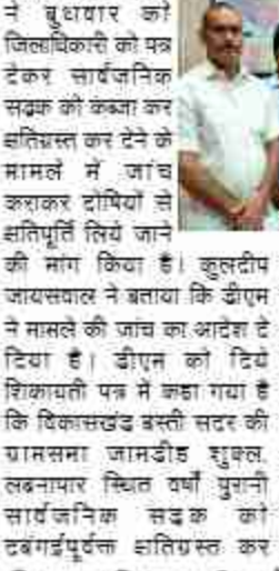
जिलाधिकारी ने जनता दर्शन के दौरान सुनी जनसमस्याएं