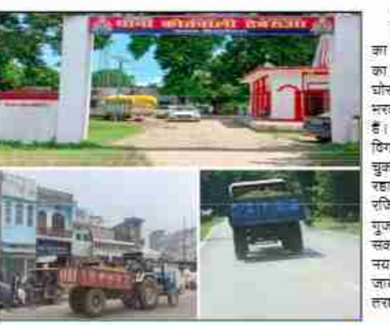
दैनिक बुद्ध का संदेश बड़नी/सिद्धार्थनगर। धाना क्षेत्र डेवरुआ में अश्व मिट्टी खनन का कारोबार रुकने का नाम नहीं ले रहा है। सूत्रों से मिली जानकारी अनुसार ताजा मामला मंगलवार का बताया जा रहा है। जहां पर डेवरुआ धाना क्षेत्र के टीराम बरगदवा धनीरा बुजुर्ग, घोरही नदी के आस-पास खाली पड़ी जमीनों पर रिपर लगाकर खनन माफिया मिट्टी भरकर नगर पंचायत बड़नी क्षेत्र में छो रहे निर्माण कार्यों में सहयोग प्रदान कर रहे हैं। जबकि उक्त जगहों से अश्व खनन के दौरान शोहरतगढ़ तहसील प्रशासन ने विगत कई माह पहले एक ट्रैक्टर-ट्राली पकड़कर कोरम पुरा करने हुए कार्रवाई कर चुका है। लेकिन सेटिंग-गोडिंग के जरिए यह अश्व कारोबार रुकने का नाम नहीं ले रहा है। कई ट्रैक्टर चालक बिना डीएल के ऐसे अश्व कार्यों में निजी पि कार्य हेतु रजिस्टर्ड ट्रैक्टर-ट्रालिया बिना नम्बर प्लेट के सड़कों पर दौड़ा रहे हैं कि सामने से गुजरने वाले लोगों के रोगटो खड़ी हो जाती है। जिससे कमी भी सड़क दुर्घटना हो सकती है। उक्त सम्बन्ध में एचडीएम शोहरतगढ़ विवेक कुमार मिश्र ने कहा कि अभी नया आया है। मामला संज्ञान में आया है जांच काराकर इस पर कड़ी कार्रवाई की जायेगी। वहीं खनन अधिकारी मुकेश कुमार मिश्र ने कहा कि बरसात की दिनों में इस तरह की खनन करना संज्ञान में आया तो कार्रवाई चुनिचुत की जायेगी।

दैनिक बुद्ध का संदेश उसका बाजार/सिद्धार्थनगर। धाना क्षेत्र उसका बाजार के देशी मटिरा की दुकान पर युवकों के बीच जमकर मार-पीट और हत्यापाई हुआ है, जिसका वीडियो तेजी से वायरल हो रहा है। आपको बता दें कि उसका बाजार के भारतीय स्टेट बैंक के पीछे स्थित मटिरा की दुकान पर युवकों के बीच जमकर मार-पीट और हत्यापाई को लेकर सोशल मीडिया पर वीडियो खूब तेजी से वायरल हो रहा है। वीडियो वायरल दो दिन पूर्व का बताया जा रहा है धाना क्षेत्र उसका बाजार के भारतीय स्टेट बैंक के पीछे मटिरा के दुकान का वायरल वीडियो बताया जा रहा है।