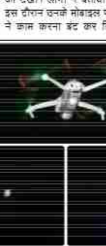
था, जिससे उनमें दहशत फैल गई। यह घटना ऐसे समय में हुई है जब हाल ही में नेपाल के रास्ते तीन पाकिस्तानी आतंकवादियों के पकड़े जाने की पुष्टि हुई है, जिसके बाद से ही सीमा पर सुरक्षा एजेंसियां हाई अलर्ट पर हैं। बावजूद इसके

दैनिक बुद्ध का संदेश बड़नी/सिद्धार्थनगर। इण्डो-नेपाल बॉर्डर बड़नी से सटे कस्बा बड़नी क्षेत्र में सोमवार की रात आसमान में कई ड्रोन देखे जाने से हड़कम्प मच गया। एक-दो नहीं, बल्कि कई जगहों पर ड्रोन देखने को मिले। इससे जहां सुरक्षा एजेंसी अलर्ट हो गई वहीं दूसरी ओर सीमावर्ती ग्रामीणों के लोग दहशत में आ गए। हालांकि कुछ यह पता नहीं