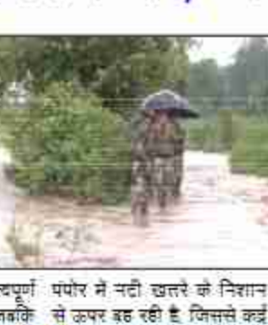
पंपोर में नदी खतरे के निशान से ऊपर बह रही है, जिससे कई

में चिनाब नदी उफान पर है, जिससे गनखल गांव जलमग्न हो गया है। गनखल गांव में फंसे ग्रामीणों को भारतीय सेना और एनडीआरएफ द्वारा सुरक्षित स्थानों पर ले जाया जा रहा है। अधिकारियों ने बताया कि संगम में जलस्तर 26 फीट के महत्वपूर्ण स्तर को पार कर गया है, जबकि