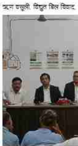
अम संबंधी मामले, एच अन्य सिधिल प्र ति के प्रकरणों को प्राम्भिकता देने की बात कही

अदालत न्यायिक व्यवस्था का एक ऐसा सशक्त माध्यम है, जिससे जनता को त्वरित, सस्ता और सौहार्दपूर्ण न्याय प्राप्त होता है। यह वैकल्पिक विवाद समाधान प्रणाली का एक सफल रूप है, जिससे न्यायालयों पर बोझ कम होता है और न्याय प्रक्रिया में दिबास बढ़ता है। उन्होंने कहा कि लोक अदालत में वे ही वाद शामिल किए जाएं जिनमें समझौते की प्रवृत्त संभावना हो। इसके लिए प्रत्येक न्यायिक अधिकारी को निर्देशित किया गया कि वे अपने न्यायालय में त्वरित व विचारणीय मामलों की चुर्की तैयार करें और उनमें से उपयुक्त प्रकरणों का चयन करें। विशेष रूप से घेक बाउंस पारिवारिक विवाद, वाहन दुर्घटना दावे, बैंक