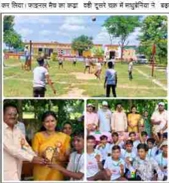
मुकाबला देवरा चौधरी और मधुबेनिया के बीच हुआ, पहले चालू में देवरा चौधरी ने मधुबेनिया को 18 अंक से पराजित किया

दैनिक बुद्ध का संदेश सिद्धार्थनगर। इलाक स्तरीय वालीबाल प्रतियोगिता पूर्व माध्यमिक विद्यालय देवरा चौधरी में सम्पन्न हुआ, जिसका सुचारु रूप से परिचय प्राप्त करके किया। इलाक स्तरीय वालीबाल प्रतियोगिता में मेजबान पूर्व माध्यमिक विद्यालय देवरा चौधरी के अलावा पीएम श्री कम्पोजिट विद्यालय मधुबेनिया, कम्पोजिट विद्यालय काशीपुर और सूर्यकुण्डिया के बच्चों ने भाग लिया। पहला मुकाबला मधुबेनिया और सूर्यकुण्डिया के मध्य खेला गया, जिसमें मधुबेनिया ने पहले चालू में 14 अंक से जीत हासिल कर फाइनल में अपना स्थान बना लिया। वहीं दूसरा मुकाबला काशीपुर और देवरा चौधरी के मध्य हुआ, जिसमें देवरा चौधरी ने काशीपुर को हराकर फाइनल के लिए अपना स्थान सुरक्षित