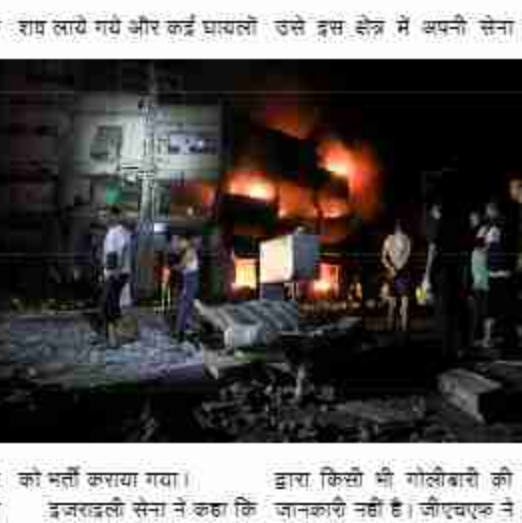
इजराइली सेना ने कहा कि गाजा में गोलीबारी की जानकारी नहीं है। जीएचएफ ने

गाजा के 20 लाख से अधिक लोगों तक भोजन पहुंचाना था। लेकिन संयुक्त राष्ट्र, साझेदारों और फलस्तीनियों का कहना है कि अब भी बहुत कम सहायता आ रही है। गाजा के बाहर महीनों से आपूर्ति का डेर लगा हुआ है और वह इजराइल की मजबूरी का इतजार है। प्रत्यक्षदर्शियों ने बताया कि दक्षिणी शहर राफा में जीएचएफ के संचालन स्थल से सैकड़ों मीटर की दूरी पर स्थित शाकीबा क्षेत्र में कम से कम दो लोग मारे गए। निकटवर्ती खान यूनिस को मर्ती कराया गया। इजराइली सेना ने कहा कि