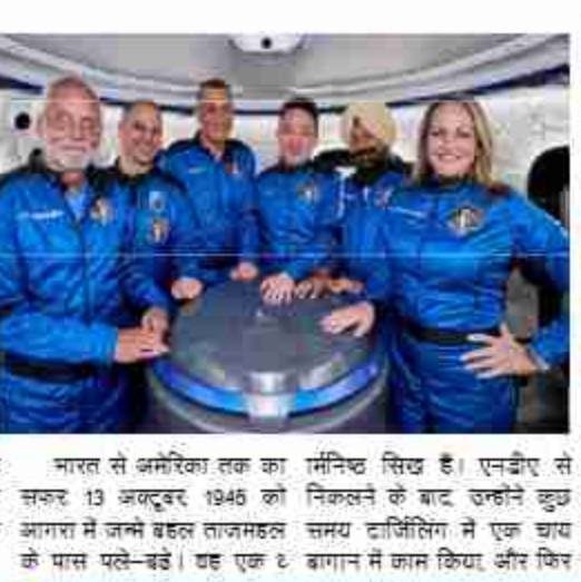
भारत से अमेरिका तक का रमिन्थ सिद्ध है। एनबीए से सफर 13 अक्टूबर, 1945 को निकलने के बाद, उन्होंने कुछ समय टांजिलिंग में एक चाय बागान में काम किया और फिर

किए हैं। उन्होंने बुनिया के सभी 198 देशों और सात महाद्वीपों की यात्रा की है। वह उत्तरी और दक्षिणी ध्रुव पर जा चुके हैं। माउंट एवरेस्ट के ऊपर स्काईड्राइविंग कर चुके हैं और गीजा के पिरामिडों का भी दौरा कर चुके हैं। उनके पास एक निजी पायलट लाइसेंस भी है। उनकी यात्राओं में उन्हें मानव और चीन सबसे ज्यादा पसंद आए। एक जोटोभाषण के रूप में उनके पास दस लाख से ज्यादा तस्वीरों का संग्रह है। उन्होंने अपनी यात्राओं पर टायरलेस ट्रेवेलर नामक एक किताब भी लिखी है।