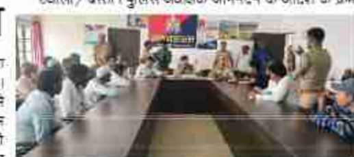
मीटिंग में नमाज के समय नमाज पढ़ने वाले मौलवी व कुर्बानी करने वाले व्यक्ति, जानवरों कुर्बानी स्थल आदि के बारे में वार्ता किया गया लोगों से आगामी त्योहार के विषय में वार्ता किया गया।