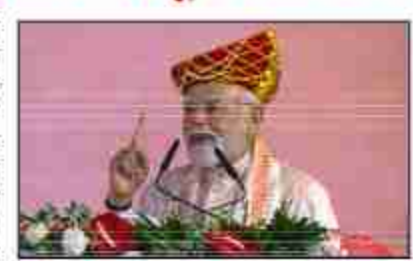
रामनाथि में रहे हनुमानजी भी सिंदूर को ही धारण किए हुए हैं। शक्ति पूजा में हम सिंदूर का अर्पण करते हैं और यही सिंदूर अब भारत के शौर्य का प्रतीक बना है। उन्होंने कहा कि पहलवाम में आतंकियों ने सिर्फ भारतीयों का

भोपाल। प्रधानमंत्री नरेन्द्र मोदी ने शनिवार को ऑपरेशन सिंदूर के जरिए आतंकवाद के खिलाफ भारत की मजबूत और सशक्त प्रतिक्रिया को रेखांकित करते हुए घोषणा की। भोपाल में बोलते हुए पीएम मोदी ने ऑपरेशन सिंदूर को आतंकवाद के खिलाफ भारत का सबसे बड़ा और निर्णायक हमला बताया। उन्होंने कहा कि ऑपरेशन सिंदूर आतंकवादियों और उनकी बस्तियों पर भारत का सबसे बड़ा हमला है। यह देश की ताकत का प्रतीक है। प्रधानमंत्री ने इस बात पर भी जोर दिया कि ऑपरेशन सिंदूर न केवल भारत के सैन्य संकल्प का प्रतीक है, बल्कि इसकी बढ़ती महिला शक्ति का भी प्रतीक है। मोदी ने कहा कि भारत संस्कृति और संस्कारों का देश है। सिंदूर हमारी परंपरा में नारीशक्ति का प्रतीक है।