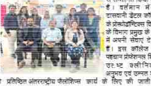
प्रतिष्ठित अंतरराष्ट्रीय फेलोशिप कार्य के लिए की जाती है

से सम्मानित किया गया है। वर्तमान में वे दासवानी डेंटल कॉलेज के प्रोफेडोरियल विभाग के विभाग प्रमुख के रूप में अपनी सेवाएं दे रहे हैं। इस कॉलेज की पहचान प्रोफेसरन शिवा उरुष्ट क्लीनिकल अनुभव एवं उन्नत शौचों के लिए की जाती है