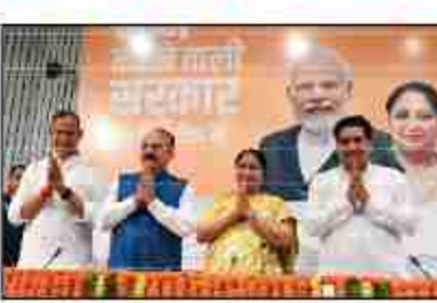
दिल्ली विधानसभा चुनाव में 48 सीटें जीतकर भाजपा ने 27 साल बाद राष्ट्रीय राजधानी में सरकार बनाई, जबकि 22 सीटों के साथ आम आदमी पार्टी (आप) विपक्ष में आ गई। वहीं, इस अवसर पर नरेन्द्र मोदी ने कहा कि मुझे बहुत दुःख होता है जब मैं उन लोगों के

सीएम रेखा गुप्ता बोलीं- सड़कों पर लोगों के बीच कर रहे काम