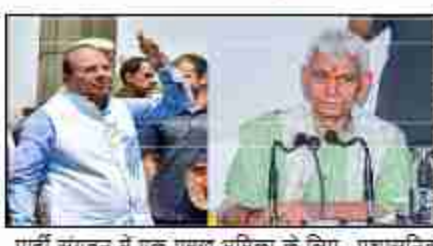
पार्टी संगठन में एक प्रमुख भूमिका के लिए विचार किया जा रहा है। नाम न छापने की शर्त पर एक भाजपा नेता ने कहा कि सिन्हा सबसे अच्छे चुनावी रणनीतिकारों में से एक हैं और एक सफल टास्कमास्टर हैं। पार्टी