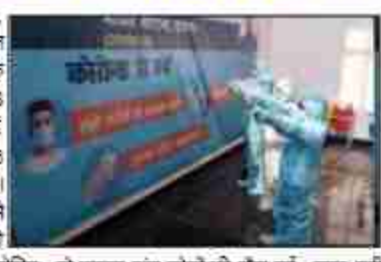
कोविड-19 के कारण पांच लोगों की मौत हुई है। वहीं, जनवरी 2025 में सबसे ज्यादा मौतें महाराष्ट्र में हुई हैं जहां कुल 7 लोगों की जान गई है। सभी राज्यों में कुल 22 मीते

इसके बाद महाराष्ट्र (424), दिल्ली (294) और गुजरात (223) का स्थान है। कर्नाटक और तमिलनाडु में 146-148 मामले दर्ज किए गए हैं जबकि पश्चिम बंगाल में 116 मामले दर्ज किए गए हैं। जारी किए गए आंकड़ों से पता चलता है कि जनवरी 2025 से अब तक दिल्ली में कोविड के कारण दो मीते हुई हैं। इनमें एक 80 वर्षीय महिला भी शामिल है जिसकी मौत तीर्थ आंध्र प्रदेश के कारण हुई। केरल में कोविड के कारण पांच लोगों की मौत हुई है। वहीं, जनवरी 2025 में सबसे ज्यादा मौतें महाराष्ट्र में हुई हैं जहां कुल 7 लोगों की जान गई है। सभी राज्यों में कुल 22 मीते