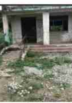
अन्धाकार की च जांच-पड़ताल कर ले। बाह र विभाग। बाह के अधिकारी। सभी अन्धाकार की सरिता में अपलोडन ले रहे हैं। इस प्रकार का मामला है जनपद-कुशीनगर के तहसील-तमकुहीराज के दुदही विकास छाण्ड क्षेत्र के ग्राम पंचायत चाफ मुसहर टोली की, जहां

निकलते ही सामान गायब हो जाता है। अफसोस है उन आंगनबाड़ी कार्यकर्तियों पर जिसने भूखे-प्यासे नादान दुध मुहें बच्चों का हक जिन कर काली कमाई कर ले आ रहे हैं। अफसोस है उन लूटने टिमागीय अधिकारियों व कर्मचारियों पर जिसने पापच की कमाई में हथ डूबोकर विभाग का सत्पानाश कर रहे हैं और सम्बंधित उच्च पदस्था अधिकारियों सहित शासन-प्रशासन को बदनाम कर कलंकित करते आ रहे हैं। आखिर में वर्षों से ऐसा व्यो होता आ रहा है। इसे करने व कराने वाले कौन हैं जो अन्धाकार रूपी पाप की कमाई में हाथ डूबोकर संरक्षण दे रहा है। है कोई अधिकारी जो