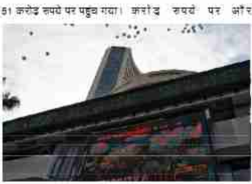
शीर्ष 10 कंपनियों में सबसे अधिक लाभ में रिलायंस इंडस्ट्रीज की रही। भारतीय एयरटेल की बाजार वैल्यू 51,880.85 करोड़ रुपये बढ़कर 11,58,329.94

बीते सप्ताह बीएसई का 30 शेयरों वाला संसेक्स 1,660.73 अंक या दो प्रतिशत घट गया। शीर्ष 10 कंपनियों में सिर्फ इन्फोसिस के बाजार मूल्यवान में गिरावट आई। समीचीन सप्ताह में रिलायंस इंडस्ट्रीज का बाजार मूल्यवान 89,556.91 करोड़ रुपये बढ़कर 20,51,590.