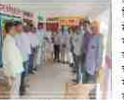
उत्तर प्रदेश की प्रथमिक शिक्षक संघ के कार्य समिति के सचिव संस्कार को बी.एल.सी. लोटेन के प्रांगण में चर्चा किया गया एवं शासनद्वारा 18 जून 2025 के आदेशानुसार विद्यालय पुनरीकरण लोगों के द्वारा असहमति व्यक्त की गई है, उपस्थित शिक्षक गणों का कहना है कि विद्यालय पुनरीकरण से छंटे एवं गरीब घर के बच्चे शिक्षा से वंचित रह जायेंगे, विद्यालय से विद्यालय की दूरी 2 से 3 किलोमीटर

लोटन/सिद्धार्थनगर। विकास खण्ड लोटन क्षेत्र अन्तर्गत किये जा रहे पुनरीकरण विद्यालय के संबंध में ग्राम प्रधान अभिभावक एवं