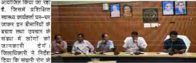
विशेष संचारी रोग नियंत्रण एवं दस्तक अभियान तथा संचारी रोगों पर प्रभावी नियंत्रण के सम्बन्ध में हुई बैठक

उन्होंने बताया कि इस अभियान के अन्तर्गत दिमागी बुझार, सय रोग, कुष्ठ रोग, फाइबरिया एवं कालाजार रोगों के लक्षणयुक्त रोगियों को रिकवर्ड कराया। शौचालय का उपचार करने हेतु लोगों को जागरूक करें। नालियों की साफ-सफाई एवं दूधको का डिब्बाए करने का निर्देश दिया। जिलाधिकारी ने विकास खण्ड डुमरियागंज में प्रविष्ट नही हुआ था जिस पर जिला बेंसिक शिक्षा अधिकारी पर कड़ी नाराजगी व्यक्त की। मुख्य चिकित्सा अधिकारी द्वारा अद्यतन कराया गया कि संचारी रोग नियंत्रण अभियान 01 जुलाई 2025 से 31 जुलाई 2025 तक आयोजित किया जा रहा है। इस अभियान को प्रभावी रूप से भूमिका निभाने के लिए आशा, आंगनबाड़ी एवं एएनएनए, स्कूली शिक्षा, ग्राम प्रधान की अहम भूमिका है।