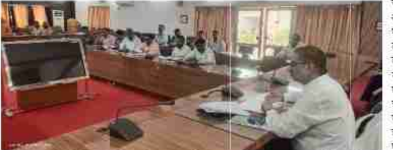
जयपुर व बच्चों के अभिभावकों से मिलकर बच्चों को स्कूल भेजने व विद्यालयों में सरकार द्वारा मिलने वाले सुविधाओं की जानकारी भी दी जाये। उन्होंने जिला बेसिक शिक्षा अधिकारी को निर्देशित करते हुए कहा कि जनपद में ऐसे विद्यालय जो जर्जर/गिरिस्त अथवा नई हैं, उनका निरीक्षण हर हाल में करना सुनिश्चित कर लें, ताकि भवन की स्थिति का पता चल सकें, जो भवन काफ़ी जर्जर