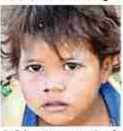
के नीचे दबकर घायल हो गईं। स्वजन व खुनुवां चौकी पुलिस की मदद से उसे उपचार के लिए