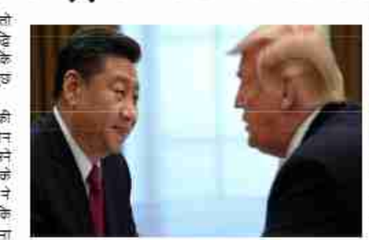
चीनी प्रवक्ता ने साफ किया कि टैरिफ युद्धों में कोई विजेता नहीं होता। जबरदस्ती और दबाव से कुछ हासिल नहीं होगा। चीन अपनी संप्रभुता, सुरक्षा और