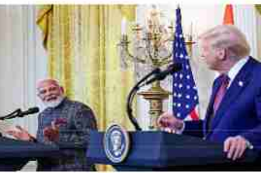
डॉलर की एक मजबूत अर्थव्यवस्था है जो किसी भी दबाव का सामना कर सकती है। सरकार अपने किसानों और कु

टैरिफ वॉर का प्रहार झेलना पड़ा और उस पर 25 का टैरिफ लगा दिया गया है। लेकिन ट्रंप की भारत को दबाव में लाने की नीति कारगर नहीं रहने वाली है क्योंकि कहा जा रहा है कि भारत किसी भी दबाव में अपनी नीतियों से समझौता नहीं करने वाला है। सूत्रों ने बताया कि कैंट सरकार जोनाल्ड ट्रंप द्वारा लगाए गए 25 प्रतिशत टैरिफ और जुमनि के बायबुट दुड़ है और भारत 4 ट्रिलियन अमेरिकी