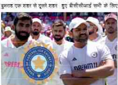
बुमराह एक राउंड से दूसरे राउंड हुए बीसीसीआई सभी के लिए नहीं किया। इसके अलावा बॉर्डर ने अंग्रेजी को ये स्पष्ट कर दिया है कि सभी खिलाड़ी टीम बस में यात्रा करेंगे इससे टीम में एकता आएगी। कोई भी बड़ा खिलाड़ी अंगल से ट्रेवल नहीं करेगा। इसके अलावा टीम के हेड का निजी मैनेजर टीम बस या टीम के पीछे चलने वाली बस में ट्रेवल नहीं कर सकता और उसे वीआईपी बॉक्स की सुविधाएं भी प्रदान नहीं की जाएगी। इसके अतिरिक्त खिलाड़ियों पर अब ये भी पाबंदी लगाए जाने पर विचार है कि 150 किलो से ज्यादा सामान अगर वे पलाइंट में ले जाते हैं तो इसका पैसा उनको खुद भरना होगा। बीसीसीआई द्वारा सुझाए गए

बीसीसीआई इंग्लैंड के खिलाफ करीब दो महीने लंबी टेस्ट सीरीज से पहले कुछ नए और पुराने नियमों को लागू कर सकता है। इंडिया टुडे की रिपोर्ट के मुताबिक, इनमें सबसे कड़ी पाबंदी खिलाड़ियों के लिए ये है कि वे अपने परिवार को 48 दिन या इससे ज्यादा लंबे टूर्नामेंट या सीरीज के दौरान साथ नहीं रख सकते। ज्यादा से ज्यादा दो सप्ताह ही पत्नी या परिवार खिलाड़ियों के साथ रह सकता है। अगर दौरा या ट्वेंटी ट्वेंटी के दो परिवार और पार्टनर सात दिन से ज्यादा समय होटल में नहीं ठहरेगा। बॉर्डर-गावस्कर ट्रॉफी के दौरान बल्लेबाज रिषाट कोहली और तेज गेंदबाज जसप्रीत