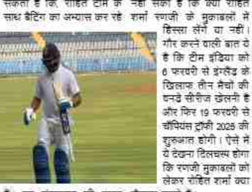
सकता है कि, रोहित टीम के साथ बैटिंग का अभ्यास कर रहे हैं। शर्मा रणजी के मुकाबलों में हिस्सा लेंगे या नहीं। गौर करने वाली बात ये है कि टीम इंडिया को 6 फरवरी से इंग्लैंड के खिलाफ तीन मैचों की ट्वेंटी ट्वेंटी सीरीज खेलनी है और फिर 19 फरवरी से वॉशिंगटन ट्रॉफी 2025 की शुरुआत होगी। ऐसे में ये देखा दिलचस्प होगा कि रणजी मुकाबलों को लेकर रोहित शर्मा क्या फैसला करते हैं। अभ्यास के लिए वॉशिंगटन टेस्ट ने आखिरी बार 10 साल पहले कप्तान फॉर्म में वापसी करना 2015 में मुंबई के लिए रणजी ट्रॉफी मैच खेला था। इसके चरण की शुरुआत 23 जनवरी से होगी। हालांकि, अभी ये साफ कोई मुकाबला नहीं खेला।

भारतीय कप्तान रोहित शर्मा वापसी करने के लिए पूरी तरह से तैयार दिख रहे हैं। ऑस्ट्रेलिया के दौरे पर खेती गई बॉर्डर-गावस्कर ट्रॉफी 2024-25 में भारतीय कप्तान पूरी तरह से परतार रहे हैं। उन्होंने इस दौरान 3 मैचों को सिर्फ 31 रन स्कोर किए थे। अब इंग्लैंड के खिलाफ होने वाली अगली टेस्ट सीरीज से पहले रोहित शर्मा मुंबई की रणजी ट्रॉफी के साथ अभ्यास करते हुए नजर आए। रणजी टीम के साथ रोहित शर्मा की तस्वीर तेजी से वायरल हो रही है। तस्वीर में देखा जा