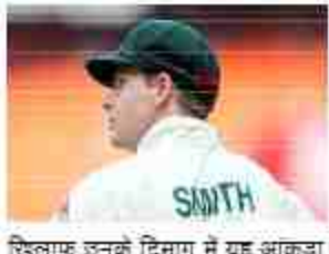
स्मिथ को इस आंकड़े तक पहुंचने के लिये 38 रन की जरूरत थी लेकिन भारत के खिलाफ आखिरी टेस्ट में यह 37 रन ही बचा सके।

सिडनी। सिडनी में अपने घरेलू मैदान पर भारत के खिलाफ पांचवें और आखिरी टेस्ट में दस हजार टेस्ट रन पूरे करने से एक रन से चुके आस्ट्रेलिया के स्टार बल्लेबाज स्टीव स्मिथ ने कहा कि टेस्ट क्रिकेट में 10000 रन पूरे करना अलग ही बात है और भारत के खिलाफ उनके दिमाग में यह आंकड़ा घूमता रहा। स्मिथ को इस आंकड़े तक पहुंचने के लिये 38 रन की जरूरत थी लेकिन भारत के खिलाफ आखिरी टेस्ट में यह 37 रन ही बचा सके। आस्ट्रेलिया ने यह टेस्ट उधे विकेट से जीतकर एक ड्रक बाट बॉर्डर गावस्कर ट्रॉफी अपने नाम की। स्मिथ ने सेन 1170 ब्रेकफास्ट शो पर कहा, 'मैं आंकड़ों के बारे में ज्यादा नहीं सोचता लेकिन 10000 रन अलग बात है। इमानदारी से कहूँ तो यह मेरे दिमाग में घूम रहा था। मैच से पहले मीडिया इस बारे में इतनी बात कर रहा था क्योंकि मैं उस आंकड़े के करीब था।' नंबर 38 स्मिथ के दिमाग में इतना चल रहा था कि उन्होंने मजाक में कहा कि वह जोरा हेजलवुड से हमेशा इसे जोड़कर देखेंगे क्योंकि हेजलवुड का जर्सी नंबर 38 है। उन्होंने कहा, 'मुझे पता था कि मुझे 38 रन चाहिए। मैं उस रात सोने गया तो हेजलवुड की शर्ट का पीछे का हिस्सा मुझे दिख रहा था क्योंकि उस पर 38 लिखा है। यह अजीब था क्योंकि यह मेरे दिमाग में लगातार घूम रहा था। खुशी की बात यह है कि हम मैच जीतने में सफल रहे सिवाय यह मायने नहीं रखता था। आस्ट्रेलियाई टीम अब दो टेस्ट की अखंडता के लिये श्रीलंका का दौरा करेगा जिसका पहला टेस्ट 29 जनवरी से गॉल में खेला जायेगा। स्मिथ ने कहा, 'सिडनी में अपने दोस्तों और परिवार के सामने इस आंकड़े तक पहुंचना शानदार होता लेकिन ऐसा हुआ नहीं। मैंने कभी सोचा नहीं था कि कैरियर में इस मुकाम तक पहुंच सकूंगा लेकिन यह सपना सच होने जैसा है।