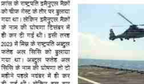
राष्ट्रपति प्रबोवो सुबियांतो भारत में गणतंत्र दिवस की परेड में हिस्सा लेने के तुरंत बाद पाकिस्तान आएंगे। दो पाकिस्तान में दो दिनों तक रहेंगे। लेकिन ये बात भारत को पसंद नहीं आई। सूत्रों के मुताबिक

28 जनवरी की परेड से पहले भारत ने एक बड़ा खेल कर दिया है। दावा किया जा रहा है कि भारत ने सबसे बड़े मुस्लिम देश इंडोनेशिया के राष्ट्रपति का विमान मुड़वा दिया है। मीडिया रिपोर्ट्स के मुताबिक इस बार 26 जनवरी पर इंडोनेशिया के राष्ट्रपति प्रबोवो सुबियांतो चीफ गेस्ट के तौर पर आ रहे हैं। लेकिन मज की बात ये है कि भारत ने अभी तक इस पर कोई आधिकारिक बयान जारी नहीं किया है। ऐसा पहली बार हो रहा है कि अभी तक 26 जनवरी के बीच गेस्ट के नाम की घोषणा आधिकारिक तौर पर नहीं हुई है। 2024 पर नजर डालें तो