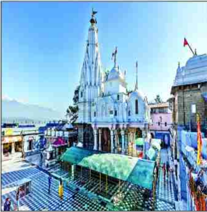
पूरु मंदिर मार्ग को रंग-बिरंगी रोशनी से सजाया जाता है और इसके साथ ही मंदिर परिसर में फूलों की साज-सज्जा भी की जाती है, जो देखने में बहुत सुंदर लगती है। बज्रेश्वरी जिला स्तरीय नगरकोट मकर संक्रांति पर्व के मौके पर दो दिवसीय सांस्कृतिक संस्थाओं का आयोजन होगा।

परंपरा से यह विश्वास किया जाता है कि इसी दिन सूर्य मकर राशि में प्रवेश करता है। यह वैदिक उत्सव है। इस दिन खिचड़ी का भोग लगाया जाता है। गुड़, तिल, रेवड़ी, गजक का प्रसाद बांटा जाता है। इस त्योहार का संबंध प्रकृति, ऋतु परिवर्तन और कृषि से है। मकर संक्रांति भारत के प्रमुख त्योहारों में से एक है। यह पर्व प्रत्येक वर्ष जनवरी के महीने में समस्त भारत में मनाया जाता है। इस दिन से सूर्य उत्तरायण होता है, जब उत्तरी गोलार्ध सूर्य की