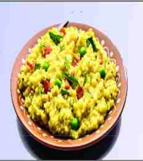
ओर बुद्ध जाता है। परंपरा से यह विश्वास किया जाता है कि इसी दिन सूर्य मकर राशि में प्रवेश करता है। यह वैदिक उत्सव है। इस दिन खिचड़ी का भोग लगाया जाता है। गुड़, तिल, रेवड़ी, गजक का प्रसाद बांटा जाता है।

अधिरासी अधिकारी नगर पंचायत गायघाट, बस्ती अध्यक्ष नगर पंचायत गायघाट, बस्ती