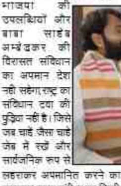
दैनिक बुद्ध का संदेश भाजपा जिला कार्यालय पुनरा स्थाभिमान विषय पर वृषुज निःक