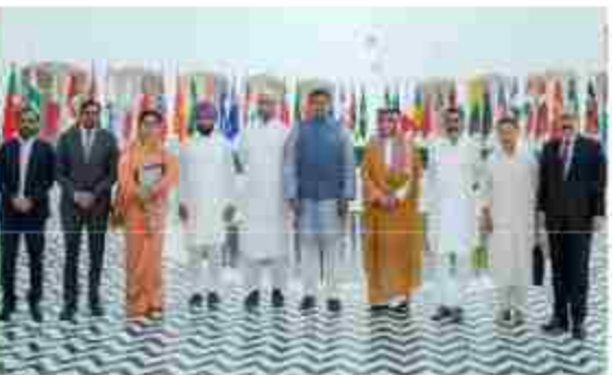
भारत के साथ एकजुटता व्यक्त की। आतंकवाद को लेकर पाकिस्तान की हरकतों और उस

रियाद। आतंकवाद के विरुद्ध लड़ाई में भारत के सपोर्टिव संसदीय प्रतिनिधिमंडलों को वैश्विक नेतृत्व में मरपुर सम्मेलन मिला रहा है। कुत्तार को सरुदी अरब ने कहा कि यह पाकिस्तान प्रायोजित आतंकवाद के विरुद्ध लड़ाई में भारत के साथ है। इटली ने द्विपक्षीय सहयोग का प्रस्ताव दिया है। जबकि इंडोनेशिया ने हरसंभव मंच पर भारत के रुख को समर्थन देने का भरोसा दिलाया। दक्षिण अफ्रीका ने आतंकवाद के विरुद्ध भारत की श्रृंखला सहिष्णुता को सराहा।