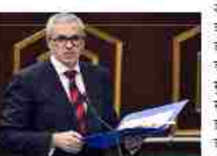
उमर अब्दुल्ला ने कहा कि बंदूक से आतंकवाद को नियंत्रित नहीं कर सकते, लेकिन अगर...

श्रीनगर। जम्मू-कश्मीर के मुख्यमंत्री उमर अब्दुल्ला ने सोमवार को कहा कि उनकी सरकार आतंकवाद को खत्म करने के लिए बंदूक से आतंकवाद को नियंत्रित नहीं कर सकती, लेकिन अगर मुख्यमंत्री ने कहा कि श्रीनगर को जामिया मस्जिद में पहली बार शुकुवार की नमाज से पहले दो मिनट का मौन रखा गया। मुख्यमंत्री ने कहा, हम इस बदलाव को और मजबूत बनाने की कोशिश करेंगे। केंद्र शासित प्रदेश में पहलगाम आतंकवादी हमले के खिलाफ विरोध प्रदर्शन का जिक्र करते हुए अब्दुल्ला ने कहा कि श्रीनगर को जामिया मस्जिद में पहली बार शुकुवार की नमाज से पहले दो मिनट का मौन रखा गया। मुख्यमंत्री ने कहा, हम इस बदलाव को और मजबूत बनाने की कोशिश करेंगे। केंद्र शासित प्रदेश में पहलगाम आतंकवादी हमले के खिलाफ विरोध प्रदर्शन का जिक्र करते हुए अब्दुल्ला ने कहा कि श्रीनगर को जामिया मस्जिद में पहली बार शुकुवार की नमाज से पहले दो मिनट का मौन रखा गया।