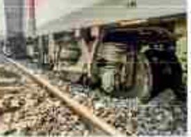
बुलंदशहर के खुर्जा जंक्शन पर मालगाड़ी के दो डिब्बे पटरी से उतरे।