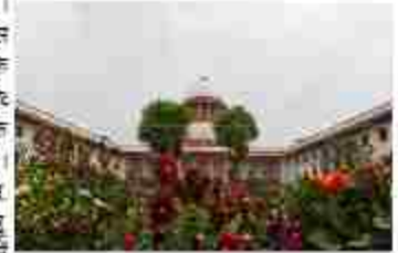
सुप्रीम कोर्ट ने ओटीटी और सोशल मीडिया प्लेटफॉर्मों को नोटिस भेजा है।

नई दिल्ली। सुप्रीम कोर्ट ने केंद्र प्रमुख ओटीटी प्लेटफॉर्म और प्रमुख सोशल मीडिया कंपनियों को एक अनिश्चित आदेश (पीआइएल) पर नोटिस जारी किया, जिसमें ऑनलाइन सेक्स सामग्री की स्ट्रीमिंग पर रोक लगाने के लिए कार्रवाई की मांग की गई है। नोटिस में कहा गया है कि ओटीटी और सोशल मीडिया प्लेटफॉर्मों पर अश्लील कंटेंट का प्रसारण समाज और नैतिकता को नुकसान पहुंचा रहा है। नोटिस में कहा गया है कि ओटीटी और सोशल मीडिया प्लेटफॉर्मों पर अश्लील कंटेंट का प्रसारण समाज और नैतिकता को नुकसान पहुंचा रहा है। नोटिस में कहा गया है कि ओटीटी और सोशल मीडिया प्लेटफॉर्मों पर अश्लील कंटेंट का प्रसारण समाज और नैतिकता को नुकसान पहुंचा रहा है।