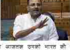
निश्चिन्ता दुबे ने बताया आतंकवाद का चेहरा, बोले- इतने कैसे लड़ें?

नई दिल्ली। भारतीय जनता पार्टी के सांसद निश्चिन्ता दुबे ने सोमवार को पाकिस्तानी आतंकवाद का चेहरा बताने के लिए एक वीडियो पोस्ट किया। उन्होंने कहा कि पाकिस्तानी लड़कियां शादी करने के बाद भारत में रह रही हैं लेकिन अभी तक उन्हें भारतीय नागरिकता नहीं मिली है। सोशल मीडिया प्लेटफॉर्मों पर दुबे ने टाग किया कि पांच लाख से अधिक पाकिस्तानी लड़कियां शादी करने के बाद भारत में रह रही हैं लेकिन अभी तक उन्हें भारतीय नागरिकता नहीं मिली है।