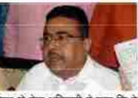
शुभेदु अधिकारी ने कहा कि पश्चिम बंगाल के दंगा प्रभावित मुर्शिदाबाद जिले में क्षतिग्रस्त मंदिरों के पुनर्निर्माण और जीर्णोद्धार का काम अक्षय तृतीया से शुरू होगा।

कोलकाता। भारतीय जनता पार्टी (भाजपा) के नेता शुभेदु अधिकारी ने सोमवार को कहा कि पश्चिम बंगाल के दंगा प्रभावित मुर्शिदाबाद जिले में क्षतिग्रस्त मंदिरों के पुनर्निर्माण और जीर्णोद्धार का काम अक्षय तृतीया से शुरू होगा।