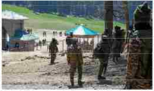
पहलगाम आतंकी हमले के बाद एक बड़ी कार्रवाई में, जिसमें 28 लोग मारे गए थे, भारत ने 16 पाकिस्तानी यूट्यूब चैनलों पर प्रतिबंध लगा दिया है।