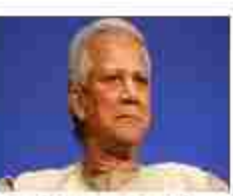
प्रोफेसर मोहम्मद यूनुस को बांग्लादेश में बिगड़ते हालात पर सेना का फूटा गुस्सा।

नई दिल्ली। अगस्त, 2025 में पूर्व पीएम शेख हसीना की लोकतांत्रिक सरकार को सत्ता से बेदखल करने के बाद अंतरिम सरकार के प्रमुख का पदभार संभाल रहे नोबल पुरस्कार विजेता प्रोफेसर मोहम्मद यूनुस को बांग्लादेश में बिगड़ते हालात पर सेना का फूटा गुस्सा। बांग्लादेश में अंतरिम सरकार के प्रमुख का पदभार संभाल रहे नोबल पुरस्कार विजेता प्रोफेसर मोहम्मद यूनुस को बांग्लादेश में बिगड़ते हालात पर सेना का फूटा गुस्सा।