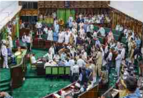
जम्मू कश्मीर विधानसभा ने पहलगाम हमले में मारे गए लोगों को श्रद्धांजलि दी।

जम्मू कश्मीर विधानसभा ने पहलगाम में दत्ते हैं और उन परिवारों के प्रति संवेदना व्यक्त करते हैं जिन्होंने अपने प्रियजनों को खो दिया है। विधानसभा अध्यक्ष ने घोषणा की कि सदन इस श्रद्धांजलि में मारे गए लोगों के सम्मान में कुछ पल का मौन रखेगा। उप मुख्यमंत्री श्री सुरिंदर चौधरी ने सरकार की ओर से एक प्रस्ताव पेश किया, जिसमें पर्यटकों पर हुए बर्बर और अमानवीय हमले को लेकर गहरा सदमा और दुःख व्यक्त किया गया। गत 22 अप्रैल को आतंकवादियों ने अंतर्नाग जिले के पहलगाम के ऊपरी इलाकों में मिनी स्पिटरजॉर्ड के नाम से मशहूर पर्यटन स्थल बसने में गोलीबारी की, जिसमें 28 लोग मारे गए। मृतकों में ज्यादातर दूसरे राज्यों से आए पर्यटक थे। विधानसभा अध्यक्ष ने घोषणा की कि सदन इस श्रद्धांजलि में मारे गए लोगों के सम्मान में कुछ पल का मौन रखेगा। उप मुख्यमंत्री श्री सुरिंदर चौधरी ने सरकार की ओर से एक प्रस्ताव पेश किया, जिसमें पर्यटकों पर हुए बर्बर और अमानवीय हमले को लेकर गहरा सदमा और दुःख व्यक्त किया गया। गत 22 अप्रैल को आतंकवादियों ने अंतर्नाग जिले के पहलगाम के ऊपरी इलाकों में मिनी स्पिटरजॉर्ड के नाम से मशहूर पर्यटन स्थल बसने में गोलीबारी की, जिसमें 28 लोग मारे गए। मृतकों में ज्यादातर दूसरे राज्यों से आए पर्यटक थे।