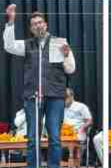
गोशंकर प्रयाग की महिमा गोरखनाथ का धाम है कपिलवस्तु की छटा पिराली मगहर में कबीर का नाम है। चौबीस घंटे बिजली भाना सुंटा सड़कों का जाल है बिजली पानी सबको मिलता उत्तर प्रदेश का नाम है। डॉ/ विनय कांत मिश्रा