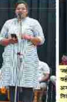
जहाँ की दुमिचें ने सबको संवाता यहे जं से प्यारा धन है हमारा अगर जाँभो जावे तो हे देतमना निरगे में लिये पढा बदल हो हमारा अरुणेश शिन्धकर्मा अनिर