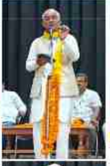
सुशासन और अमृतकाल है गतिमान यूपी में, सुरक्षा और सेवा का नया प्रतिमान यूपी में। दबंगों, माफियाओं पर शिकंजा क्रम रहे बाबा, गरीबों, खींचतों के मुंह पे है मुस्कान यूपी में। विद्याज कपिलवस्तुजी