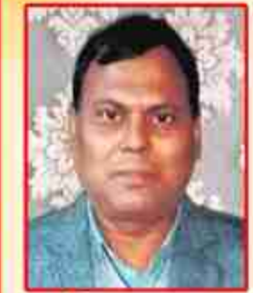
विन्ध्याकुल अधिसासी अधिकारी