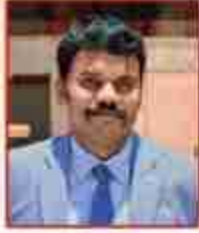
डा. राजागणपति आर. जिलाधिकारी सिद्धार्थनगर