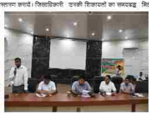
की धनराशि प्रेषित कराने का निर्देश दिया गया। सभी अधिकारीगण किसानों की समस्याओं का शत प्रतिशत