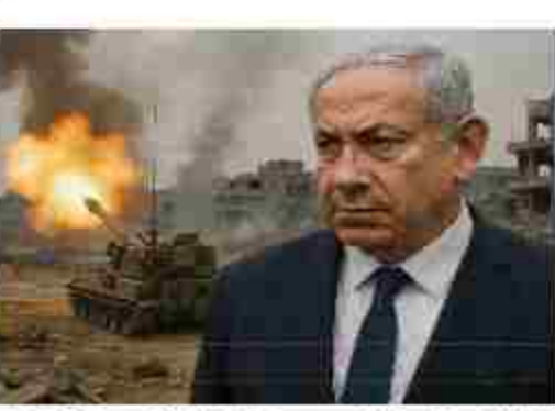
नेतन्याहू का कहना है कि जब तक हमला का खाला नहीं हो जाता, इजरायल गाजा पर हमले जारी रखेगा। लेकिन इस बीच

जिन देशों ने इजरायल के खिलाफ संयुक्त बयान जारी किया है, उनमें ऑस्ट्रेलिया, कनाडा, डेनमार्क, एस्टोनिया, फिनलैंड, जापान, लातविया, लिथुआनिया, लक्जमबर्ग, नीदरलैंड, न्यूजीलैंड, नॉर्वे, पुर्तगाल, स्लोवेनिया, स्पेन, स्वीडन और ब्रिटेन शामिल हैं। इन देशों का कहना है कि सहायता रोकने जाने से गाजा पट्टी में नवापह स्थिति पैदा हो गई है और लोग भूखमरी का शिकार हो रहे हैं। कई लोगों को गंभीर बीमारियों की दवाइयां नहीं मिल पा रही हैं और उनकी जान बचाना मुश्किल साबित हो रहा है। इन देशों का कहना है कि हमें पता है कि इजरायल ने सीमित मात्रा में मदद देने पर सहमति जताई है। लेकिन हमारी