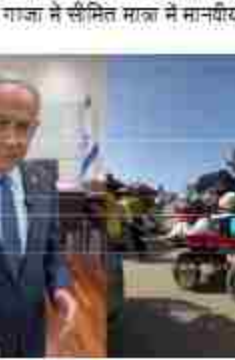
इतमारीर बोले कि ये हमारा को ऑक्सीजन देने जैसा। इजरायल के प्रधानमंत्री बेंजामिन नेतन्याहू ने एलान कर दिया कि उनकी सेना गाजा के हर हिस्से पर कब्जा करेगी। गाजा में इस एक जबरदस्त जमीनी और हवाई हमले चल रहे हैं जिसमें अब तक सैकड़ों जाने जा चुकी हैं। इजरायल की सेना ने दक्षिण गाजा के सहायता की इजाजत देगा। खाद्य पुरव्वा को लेकर बुनियावर के विरोधों की तरफ से अकाल की चेतावनी दिए जाने के बाद इजरायल ने ये फैसला लिया है। हालांकि इस फैसले को लेकर इजरायल में विरोध भी देखने को मिला। आंतरिक मामलों के मंत्री

दो महीने तक खाने पानी के समान की सप्लाई बंद रहने के बाद आखिरकार गाजा के लोगों के लिए एक राहत की खबर आई। इजरायल ने फिलहाल गाजा में खाद्य सामग्री यानी फूड सप्लाय की इजाजत दे दी है। 2 मार्च से इजरायल ने गाजा में खाने पीने की चीजों के आने पर रोक लगा दी थी। इजरायल की तरफ से गाजा में लगातार हमले जारी हैं। दावा किया जा रहा है कि ये हमले हमारा को ठिकाने पर किए जा रहे हैं। इजरायल की तरफ से एलान किया गया है कि तत्कालीन दो महीने की नाकाबंदी के बाद दो