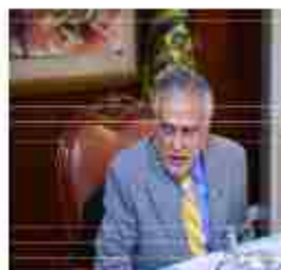
इलाक डार को रिसीव किया। आपको बता दें कि पाकिस्तान के डिप्टी प्राइममिनिस्टर

चीन में पाकिस्तान के उप प्रधानमंत्री की बेइज्जती हुई है। इलाक डार के लिए प्रोटोकॉल का पालन नहीं किया गया। डार को चीन का कोई मंत्री रिसीव करने नहीं आया। चीन के सरकारी आधिकारिक ने इलाक डार को रिसीव