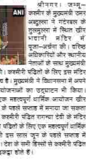
मुख्यमंत्री उमर अब्दुल्ला ने गेटेरेबल के तुलमुल्ला में स्थित खीर भवानी मंदिर में पूजा-अर्चना की।

श्रीनगर। जम्मू-कश्मीर के मुख्यमंत्री उमर अब्दुल्ला ने गेटेरेबल के तुलमुल्ला में स्थित खीर भवानी मंदिर में पूजा-अर्चना की। बरिश्द अधिकारियों और स्थानीय नेताओं के साथ मुख्यमंत्री ने मंदिर में पूजा-अर्चना की। कश्मीरी पंडितों के लिए इस मंदिर का गहरा आध्यात्मिक महत्व है। मुख्यमंत्री ने विधानसभा में अपने निर्वाचन क्षेत्र में कई परियोजनाओं का उद्घाटन भी किया। कश्मीरी पंडितों के लिए एक महत्वपूर्ण धार्मिक आयोजन खीर भवानी मेला इस साल जून के पहले सप्ताह में मनाया जा सकता है। देश को सभी हिस्सों से कश्मीरी पंडितों के प्रति समर्थन देना चाहिए है। कश्मीरी पंडितों के लिए एक महत्वपूर्ण धार्मिक आयोजन मेला खीर भवानी इस साल जून के पहले सप्ताह में मनाया जाने की संभावना है। देश के सभी हिस्सों से कश्मीरी पंडितों के प्रति समर्थन देना चाहिए है।