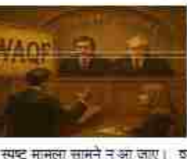
सर्वोच्च न्यायालय की पीठ ने कहा कि कानून में संशोधन की धारणा है और अदालतें तब तक हस्तक्षेप नहीं कर सकती जब तक कि कोई स्पष्ट मामला सामने न आ जाए।