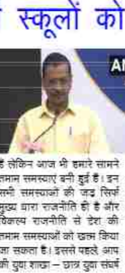
आप के राष्ट्रीय संयोजक अरविंद केजरीवाल ने छात्र शाखा-वैकल्पिक राजनीति के लिए छात्र संघ का शुभारंभ किया।

दिल्ली में बिजली कटौती हो रही है। केजरीवाल ने कहा कि हमने दिल्ली में जिस तरह की राजनीति की है, वह वैकल्पिक राजनीति है। हम यह सुनिश्चित करना चाहते हैं कि लोगों को अच्छी शिक्षा मिले, बेहतर स्वास्थ्य सुविधाएं हैं लेकिन आज भी हमारे सामने तमाम समस्याएं बनी हुई हैं। इन सभी समस्याओं की जड़ें सिर्फ मुख्य धारा राजनीति ही हैं और वैकल्पिक राजनीति से देश की तमाम समस्याओं को हल किया जा सकता है। इससे पहले आप की युवा शाखा - छात्र युवा संघर्ष