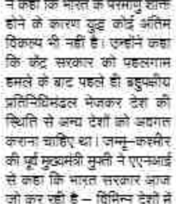
महबूबा मुफ्ती ने कहा कि हमने पहलगाम में 27-28 लोगों को खो दिया और फिर हमने और भी लोगों को खो दिया। कई डर नष्ट हो गए और हमारे शहर फूट नष्ट हो गए। बच्चे और महिलाएं मारे गए और पहलगाम में शामिल आतंकवादियों को अभी तक पकड़ा नहीं गया है।

पीपुल्स डेमोक्रेटिक पार्टी (पीडीपी) की प्रमुख महबूबा मुफ्ती ने कहा कि भारत के परमाणु शक्ति होने के कारण युद्ध कोई अंतिम विकल्प नहीं है। उन्होंने कहा कि केंद्र सरकार को पहलगाम हमले के बाद पहले ही बहुपक्षीय प्रतिनिधिमंडल भेजकर देश की स्थिति से अन्य देशों को अवगत कराना चाहिए था। जम्मू-कश्मीर की पूर्व मुख्यमंत्री मुफ्ती ने एनएसआई से कहा कि भारत सरकार आज जो कर रही है - विभिन्न देशों में प्रतिनिधिमंडल भेज रही है - उसे पहले ही अन्य देशों में जागरूकता फैलाने के लिए किया जाना चाहिए था।