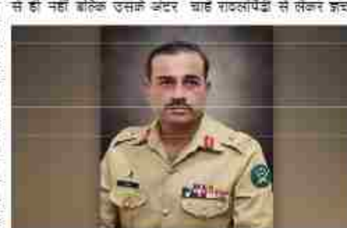
तक जाकर पूरे पाकिस्तान को निशाना बना सकते हैं। मुख्यालय