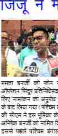
अभिषेक बनर्जी ने ममता बनर्जी से बात की।

कोलकाता। तृणमूल कांग्रेस (टीएमसी) के सांसद और राष्ट्रीय महासचिव अभिषेक बनर्जी संसदीय प्रतिनिधिमंडल में पार्टी का प्रतिनिधित्व करेंगे। यह प्रतिनिधिमंडल आतंकवाद के प्रति दृढ़-सहिष्णुता पर भारत के दृढ़ रुढ़ को ध्यान करने और पिछले महीने जम्मू-कश्मीर के पहलगाम में हुए आतंकवादी हमले के जवाब में 7 नई को बुल किए गए ऑपरेशन सिंदूर के विवरण को उजागर करने के लिए कई देशों का दौरा करेगा। यह निर्णय संसदीय कार्य मंत्री किरेन रिजिजू द्वारा टीएमसी प्रमुख