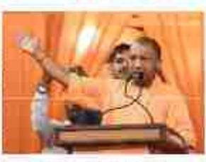
मुख्यमंत्री योगी आदित्यनाथ ने कासगंज पुलिस लाइन में पुलिस बैरिकेड और एक समारोह का उद्घाटन और निरीक्षण किया। इससे पहले सीएम योगी आदित्यनाथ ने सहकारिता विभाग की एक महत्वपूर्ण समीक्षा बैठक की अध्यक्षता की। जिसमें छोटे और सीमांत किसानों को आसन और किसानों के उत्पन्न करने की आवश्यकता पर बल दिया गया है।

दुश्मनों के सामने देश की जनता कैसे सुरक्षित रह पाएगी? योगी ने दावा किया कि पाकिस्तान बुनियादी से गुहार लगा रहा है कि एक बार उसे छोड़ दो। ऐसा इसलिए क्योंकि प्रधानमंत्री मोदी के नेतृत्व में पिछले 10 सालों में सेना को आधुनिक और मजबूत बनाने का काम हुआ है। लगातार प्रयास किए गए हैं और यही यश है कि भारतीय सेना किसी भी दुश्मन का सामना करने के लिए हमेशा तैयार रहती है। अगर दुश्मन