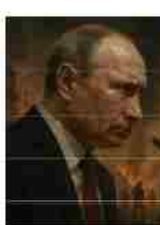
को। ट्रंप ने सोशल मीडिया पर एक पोस्ट में कहा कि इसके लिए शर्तों पर दोनो पक्षों के बीच बातचीत होगी क्योंकि ये बातचीत का विवरण जानते हैं। पुतिन ने इस काल के बाद कहा कि मौक़ो यूक्रेन में लड़ाई को समाप्त करने की दिशा में काम करने के लिए तैयार है। उन्होंने कहा कि रूस एक शांतिपूर्ण समझौते के पक्ष में है और दोनो पक्षों के अनुकूल समझौता करने की आवश्यकता होगी।

इससे पहले ट्रंप रूसी नेता प्लाटिमीर पुतिन और यूक्रेनी राष्ट्रपति वोलादिमिर जेलेन्स्की से निगश हो चुके हैं। यूक्रेन-रूस के बीच युद्धपिराम की दिशा में प्रगति की आस के साथ ट्रंप के