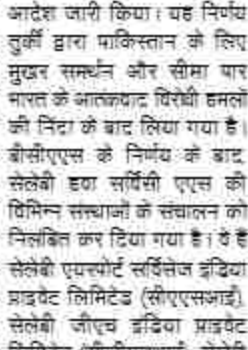
(सीजीएससी)। सेलेबी को भारतीय

तुर्की की विमानन सेवा फर्म सेलेबी एविएशन एएस ने शुक्रवार को कहा कि वह देश में अपने लाइसेंस और रियायत समझौतों की एकतरफा समाप्ति को चुनौती देने के लिए सभी प्रशासनिक और कानूनी कार्रवाइयों को तलाशेंगे। यह कदम भारत द्वारा सेलेबी की भारतीय सहायक कंपनी की सुस्था मंजूरी रद्द करने के बाद उठाया गया है जिससे इसके प्राइवेट इंडिया और कार्गो संचालन पर प्रभावी रूप से रोक लग गई है। यूरो ऑफ सिविल एविएशन सिक्थोरिटी (बीसीएस) ने गुरुवार को राष्ट्रीय सुस्था से जुड़े घितानों का हवाला देते हुए निरस्तकरण