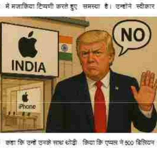
कहा कि उन्हें उनके साथ थोड़ी

जोब्स के बताए इसी रास्ते पर चल रहे हैं। इस लिए इस बात की समाप्ति बेहद कम है कि भारत छोड़ने की अमेरिकी राष्ट्रपति डोनाल्ड ट्रंप की सलाह टिम कुक ट्रंप से लेंगे। कतर की राजधानी दोहा के बिजनेस समारोह में बोलते हुए डोनाल्ड ट्रंप ने एप्पल के सीईओ टिम कुक को भारत में नया निवेश नहीं करने की सलाह दी थी। अमेरिकी राष्ट्रपति डोनाल्ड ट्रंप ने दोहा में एक व्यावसायिक कार्यक्रम में एप्पल के टिम कुक के बारे