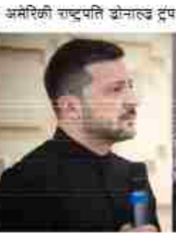
शान्त युद्धविराम मांग रहा है तो

मॉस्को के 2022 के आक्रमण के शुरुआती हफ्तों के बाद से रूस और यूक्रेन के बीच पहली सीधी शांति वार्ता इस्तांबुल में समाप्त हुई। दो घंटे से भी कम समय तक चली इस बैठक में दोनों पक्षों के 1,000 युद्धबंदियों की अदला-बदली पर सहमति बनी। जो अब तक की सबसे बड़ी अदला-बदली है। साथ ही कहा कि इन युद्धविराम पर बात करने। बैठक के बाद यूक्रेन के व्हा मंत्री इस्तान उमेरोव ने कहा कि अब अगला कदम रूसी राष्ट्रपति प्लाटिनीर पुतिन और यूक्रेनी राष्ट्रपति वोलोदिमिर जेलेन्स्की के बीच बैठक करवाने पर होगा। हालांकि युद्धविराम सशित अन्ध प्रमुख मुद्दों पर वार्ता में कोई खास प्रगति नहीं हो पाई। यूक्रेनी राष्ट्रपति वोलोदिमिर जेलेन्स्की ने कहा कि उन्होंने