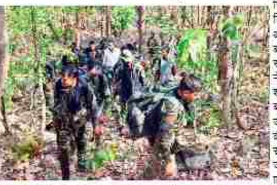
दिया गया है। ज्ञानेंद्र प्रताप सिंह ने कहा कि निष्कर्षा किए गए 31 नक्सलियों में से 28 को पहचान कर ली गई है। ऑपरेशन अरकं जॉरिस्ट नाम दिया गया था और कोबरा, सीआरपीएफ, छत्तीसगढ़ पुलिस की टीमों इस ऑपरेशन में शामिल थीं। इससे पहले किसी भी

छत्तीसगढ़ पुलिस के साथ एक संयुक्त प्रेस कॉन्फ्रेंस के दौरान एक महत्वपूर्ण घोषणा में, सीआरपीएफ के महानिदेशक ज्ञानेंद्र प्रताप सिंह ने घोषणा की कि भारत में नक्सल प्रभावित जिलों की संख्या नाटकीय रूप से घट गई है - 126 से घटकर सिर्फ 46 रह गई है। यह विकास संघर्ष क्षेत्र के केंद्र में घामफेरी उग्रवाद को खत्म करने के भारत की चाल रहे प्रयासों में एक प्रमुख मील का पत्थर है। उन्होंने कहा कि इन 31 मार्च 2028 तक नक्सलवाद को समाप्त करने के लिए केंद्रीय गृह मंत्री अमित शाह द्वारा लिए गए संकल्प को पूरा करने के लिए प्रतिबद्ध हैं। इनमें 31 हाथ (नवसलियों को) बरामद किए हैं और यह 1,200 बर्ग किलोमीटर का क्षेत्र है और इनने जानकारी है कि बड़ी संख्या में नक्सलियों को निष्कर्षा कर