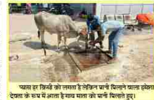
प्यास हर किमी को लगता है लेकिन पानी पिलाने वाला हमेशा देवता के रूप में आता है गांव माता को पानी पिलाने हुए।