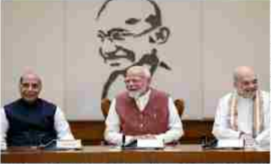
सेमीकंडक्टर मिशन को सहित कर सक 5 सेमीकंडक्टर इकाइयों को मंजूरी दी जा चुकी है और वहां तेजी से निर्माण कार्य चल रहा है। एक इकाई में दस साल उत्पादन शुरू हो जाएगा। इसी

नई दिल्ली। केंद्रीय मंत्रिमंडल ने उत्तर प्रदेश में एचसीएल-फॉक्सकॉन के संयुक्त उद्यम सेमीकंडक्टर संयंत्र की स्थापना को मंजूरी दी। इसपर 3,706 करोड़ रुपये का निवेश होगा। चुनाव एवं प्रसारण मंत्री अरिंधी वैष्णव ने इस बात की जानकारी दी। वैष्णव ने कहा कि एच सी एल-फॉक्सकॉन सेमीकंडक्टर संयंत्र में मोबाइल फोन, लैपटॉप, वाहन, अन्य उपकरणों के लिए डिस्क्रेट ड्राइवर चिप का विनिर्माण होगा। एच सी एल-फॉक्सकॉन सेमीकंडक्टर संयंत्र में प्रति माह 20,000 वेफर्स का विनिर्माण होगा। वैष्णव ने कहा कि केंद्रीय मंत्रिमंडल ने उत्तर प्रदेश के जेवर में भारत की छठी सेमीकंडक्टर