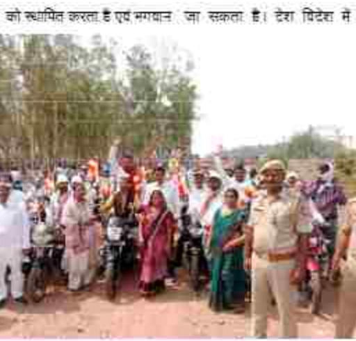
बुद्ध के बताये रास्ते पर चलकर देश दुनिया में ध्यात अष्टाचार, हिंसा, ध्वनिचार, अष्टाचार का जो महाहल है उनसे मुक्त किया

दैनिक बुद्ध का संदेश सोनमठ। सोमवार को विविध पावनो बुद्ध पूर्णिमा अर्थात् जन्म, ज्ञान प्राप्ति व महापरिनिर्वाण का पवित्र तपोहार आज वैशाख पूर्णिमा/बुद्ध पूर्णिमा के दिन पुनवाम व इषोडशत्यस के साथ मनाया गया। सर्वप्रथम तद्वागत बुद्ध विहार निकट रेलवे फाटक राबट्सगंज सोनमठ में 8:30 बजे पूजा मन्त्रे आनंद जी द्वारा बुद्ध वंदना, त्रिसरण एवं पंचशील ग्रहण कराने के बाद सुबह 9:30 बजे सैकड़ों धर्म श्रद्धालुओं के साथ धर्म प्रमातृश्रेणी/शोभायात्रा तद्वागत बुद्ध विहार से प्रारम्भ होकर राबट्सगंज नगर में रेलवे क्रासिंग से धर्मशाला चौकहा से चंडी चौरहा से बड़ौली चौकहा से मिशन अस्पताल होते हुए बड़ौली चौकहा से कचहरी होते हुए महिला धाना पुन बुद्ध विहार पहुंची। प्रमातृ