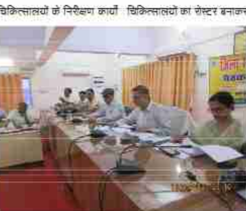
की भी समीक्षा की, समीक्षा के दौरान निजी चिकित्सालयों के नोडल अधिकारियों को निर्देशित करते हुए कहा कि प्राइवेट चिकित्सालयों का रोस्टर बनाकर निरीक्षण किया जाये और उसकी मासिक रिपोर्ट प्रस्तुत की जाये किन अस्पतालों में मौके पर डाक्टर उपलब्ध न हो उनके

स्तर पर प्रचार-प्रसार सम्पूर्ण समाधान दिवस के अवसर पर कैम्प लगाकर जन मानस के बीच में किया जाये। आयुर्वेदिक/आयुष चिकित्सालयों के पास हर्बल गार्डन स्थापित किये जाये, 14 अप्रैल 2025 को डॉ० नीम राय अम्बेडकर की जयंती के अवसर पर आयुष आरोग्य सट्टर में कार्यक्रम आयोजित किये जाये, इस दौरान उन्होंने कहा कि जनपद में नोडल अधिकारियों को निर्देशित करते हुए कहा कि प्राइवेट चिकित्सालयों के निरीक्षण कार्य चिकित्सालयों का रोस्टर बनाकर