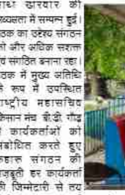
मजबूत गठन से ही पड़ती है। सबसे पहले आवश्यक है कि हम हर विधानसभा में स्पष्ट और सक्रिय संगठनात्मक ढांचा तैयार करें। पुराने कार्यकर्ताओं का अनुभव संगठन की सबसे बड़ी ताकत है। उन्हें पुनः सक्रिय कर उनकी ऊर्जा और मार्गदर्शन का लाभ लेना होगा। हमारे सामने कई चुनौतियां हैं लेकिन उनसे निपटने के लिए हमें संगठित और एकजुट होना होगा। नए कार्यकर्ताओं को जोड़ने का काम सिर्फ एक व्यक्ति की जिम्मेदारी

किसी व्यक्ति से नाराजगी है तो वह व्यक्तित्व हो सकती है लेकिन पार्टी से नाराजगी नहीं हो सकती क्योंकि पार्टी तो हमारी पहचान है। उन्होंने जोश और भावुकता के साथ आगे कहा: हमें अब सिर्फ कुछ पाने के लिए नहीं, बल्कि कुछ बनाने के लिए काम करना होगा। संगठन को मजबूत करने के लिए त्याग और समर्पण की भावना हर कार्यकर्ता और नेता में होनी चाहिए। जब हर कार्यकर्ता अपने आराम, अपने स्वार्थ, अपनी सहूलियतों को छोड़कर संगठन के लिए पसीना