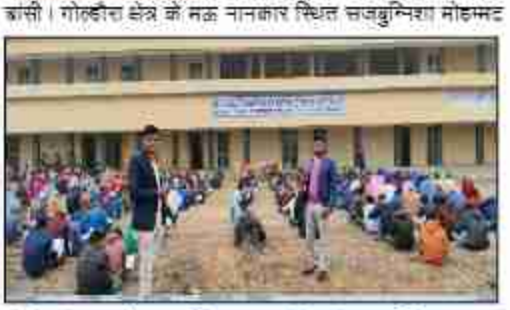
बासी। गौरीहा क्षेत्र के मक नानकार स्थित सजबुन्शिरा मोहम्मद