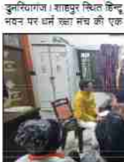
दैनिक बुद्ध का संदेश

दुमरियागंज। शाहपुर स्थित हिन्दू और जिम्मेदारों को आवश्यक नवन पर धर्म रखा मैच की एक जिम्मेदारी दिया। पूर्व पिछाचक