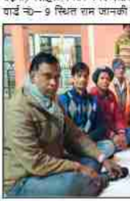
दैनिक बुद्ध का संदेश

बड़नी / सिद्धार्थनगर। नगर पंचायत बड़नी बाजार वार्ड नं-9 स्थित राम जानकी मन्दिर में कान्दू