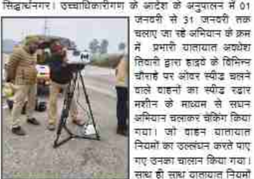
सिद्धार्थनगर। उच्चाधिकारीगण के आदेश के अनुपालन में 01