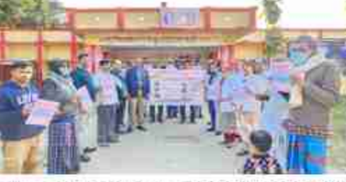
नगर खजुरिया में किया गया। सीएमओ ने बताया कि 100 दिन के टीबी मुक्त भारत अभियान में हेल्थ डेकर, आशा आंगनवाड़ी और आशा संगिनी अपने क्षेत्र के घर परिवारों में जाकर टीबी के संवादित मरीजों की जांच करेंगी। टीम जिन घरों में टीबी के पहले से मरीज है उनके परिजनों का ब्रॉच एकर कर उनके परिजनों की जांच करायेंगी। धूम्रपान करने वाले व शराब के आदी व्यक्तियों