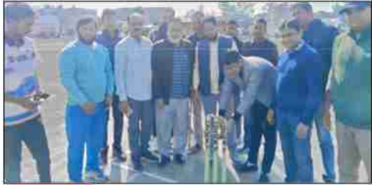
दैनिक बुद्ध का संदेश

शोहरतगढ़ / सिद्धार्थनगर। जिले के आदर्श नगर पंचायत शोहरतगढ़ के रेलवे स्टेशन के सामने स्थित वीरेंद्र ग्रामीण स्टेडियम छतहरी में रविवार को सिद्धार्थनगर क्रिकेट एसोसिएशन के द्वारा आयोजित गौतम बुद्ध आल इंडिया क्रिकेट टूर्नामेंट में सोमवार का उदघाटन मुकाबला रायबरेली व गोरखपुर के बीच खेला गया। वहीं मैच के मुख्य