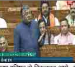
रविशंकर प्रसाद ने कहा कि कांग्रेस की सरकार के समय मात्र पांच सबसे कमजोर अर्थात्पश्चात वाले देशों की सूची में शामिल था लेकिन प्रधानमंत्री नरेन्द्र मोदी के नेतृत्व वाले सरकार में भारत की अर्थव्यवस्था बहुत मजबूत हुई तथा पांचवी सबसे बड़ी अर्थव्यवस्था बन गई। उन्होंने शिपिंग टर्लॉ पर सनातन के अपमान का आरोप लगाया और कहा, 'सनातन का अपमान नहीं सहेंगा हिंदुस्तान।