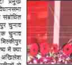
अखिलेश यादव ने कहा कि मिल्कीपुर नतीजों से लखनऊ वालों को नींद नहीं आ रही है।

अयोध्या। समाजवादी पार्टी प्रमुख अखिलेश यादव ने मिल्कीपुर विधानसभा क्षेत्र में एक सार्वजनिक रैली को संबोधित किया। उन्होंने कहा कि मिल्कीपुर चुनाव ऐतिहासिक होगा। यह सिर्फ एक चुनाव नहीं बल्कि एक इन्तुनीती भी है। मिल्कीपुर चुनाव यह भी संदेश देगा कि मधिया ने क्या होगा। भाजपा पर धार करते हुए अखिलेश ने कहा कि सुना है मिल्कीपुर नतीजों से लखनऊ वालों को नींद नहीं आ रही है। जब से अयोध्या हारे हैं तब से बीजेपी वालों को नींद नहीं आ रही है। अखिलेश यादव ने योगी सरकार पर महाकुंभ भगदड़ में मारे गए लोगों के आंकड़े छुपाए जाने का आरोप लगाया है। उन्होंने कहा कि महाकुंभ भगदड़ को सरकार छुपा रही है। सच को दबाया जा रहा है। कर्न अखाड़ों परेशान हैं। उन्होंने यह भी कहा कि एक कुंभ में लोग देशभर