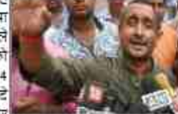
कुलदीप सिंह सेंगर को अंतरिम जमानत दे दी।