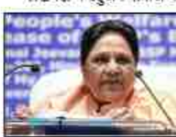
मारावती ने कहा कि संकीर्ण राजनीतिक एजेंडों को खारिज करना चाहिए और एक सच्ची समावेशी सरकार सुनिश्चित करने के लिए आंबेडकरवादी बसवा को घोट टेंना चाहिए।

लखनऊ। बहुजन समाज पार्टी प्रमुख मारावती ने दिल्ली के मतदाताओं से विधानसभा चुनावों में जाति, धर्म और क्षेत्रीय राजनीति से ऊपर उठकर उनकी पार्टी का समर्थन करने की अपील की। बसपा ने दिल्ली विधानसभा की 70 सीट के लिए 69 उम्मीदवार उतारे हैं, जहां पांच फरवरी में मतदान होगा है। मारावती ने एक बयान में दिल्ली में 'साफ पेयजल का अभाव' और 'बटहाल जीप' को मुद्दा बनाते हुए राष्ट्रीय राजधानी में सत्तारूढ़ आम आदमी पार्टी (आप) सरकार पूर्वपक्षी कांग्रेस सरकारों को राष्ट्रीय राजधानी की 'दुर्दशा' के लिए जिम्मेदार ठहराया। उन्होंने कहा 'दिल्ली के लोगों को संकीर्ण राजनीतिक एजेंडों को खारिज करना चाहिए और एक सच्ची समावेशी सरकार सुनिश्चित करने के लिए आंबेडकरवादी बसवा को घोट टेंना चाहिए। मारावती ने उत्तर प्रदेश में बसपा के कार्यकाल का भी हथाला दिया और इसे 'सर्वजन हिताय, सर्वजन सुखाय' द्वितीय सरकार बताया। उन्होंने मतदाताओं 'खासकर अधिकसित कॉलेजियों में रहने वालों को विरोधी दलों द्वारा किए जा रहे 'झूठे वादों' से प्रति आगाह किया।