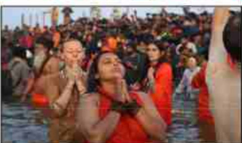
गंगामेठी उद्घोष से पूरा मेला क्षेत्र गूज उठा। अखाड़ों के साथ साधु-संत

महाकुंभनगर। बसंत पंचमी के पवित्र अवसर पर सोमवार को त्रिवेणी संगम में अमृत स्नान के लिए आस्था का जनसमुद्र उमड़ा। महाकुंभ के तीसरे अमृत स्नान पर करोड़ों अखाड़ों देर रात से ही पुण्य की कामना के साथ संगम की रेत पर एकत्रित होने लगे। सोमवार शाम 4:00 बजे तक लगभग 1.98 करोड़ स्नानार्थियों ने संगम सहित गंगा के अन्य तटों पर बुझकी लगाई इस दौरान हर-हर गंगे, बम बम मोले और जय श्री राम के