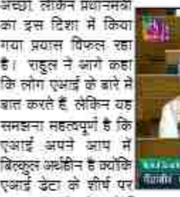
राहुल ने आगे कहा कि लोग एअई के बारे में बात करते हैं लेकिन यह समझना महत्वपूर्ण है कि एअई अपने आप में बिरुद्ध अर्थहीन है क्योंकि एअई डेटा के शीर्ष पर काम करता है। डेटा के बिना, डेटा का मतलब नहीं है। और अगर हम आप के आंकड़ों पर नजर डालें तो एक बात बहुत स्पष्ट है। उन्होंने कहा कि दुनिया में उत्पादन प्रणाली से निकलने

नई दिल्ली। लोकसभा में नेता प्रतिपक्ष राहुल गांधी ने कहा कि राष्ट्रपति का अभिभाषण पिछले कुछ सालों में दिए गए अभिभाषणों की तरह ही था। राष्ट्रपति के अभिभाषण पर लोकसभा में चर्चा में भाग लेते हुए राहुल ने कहा कि हम बेरोजगारी की समस्या को चुलका नहीं पाए हैं। ना तो संसद सरकार बेरोजगारी को लेकर युवाओं को कोई मार्ग दिखा पाई और ना ही मौजूदा सरकार कुछ कर पाई। मेरी इस बात से प्रधानमंत्री भी सहमत होंगे। उन्होंने दावा किया कि राजग सरकार का मेक इन इंडिया का विचार