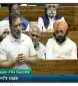
बनाने के लिए जिस डेटा का उपयोग किया जाता है उसका स्पॉन्सिड चीन के पास है। और उपनोग डेटा का स्पॉन्सिड संयुक्त राज्य अमेरिका के पास है। कांग्रेस नेता ने कहा कि इस क्षेत्र में चीन को भारत पर काम से काम 10 साल की बड़त

हासिल है। चीन पिछले 10 वर्षों से बेटी, रॉबोट, मोटर, ऑप्टिक्स पर काम कर रहा है और हम पीछे हैं। हम यह सुनिश्चित करेंगे कि हमारी ब्रेकिंग प्रणाली पर 2-3 कंपनियों का कब्जा न हो जो