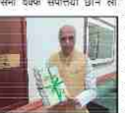
जगदंबिका पाल ने कहा कि विपक्ष एक निश्चित एजेंडा को आगे बढ़ाने की कोशिश कर रहा है और उसने कुल 428 पन्नों की रिपोर्ट में से 281 पन्नों में असहमति नोट प्रस्तुत किया है।

नई दिल्ली। वक्फ (संशोधन) विधेयक पर जेपीसी रिपोर्ट की आलोचना के बीच संयुक्त संसदीय समिति के अध्यक्ष जगदंबिका पाल ने सोमवार को कहा कि विपक्ष एक निश्चित एजेंडे को आगे बढ़ाने की कोशिश कर रहा है और उसने कुल 428 पन्नों की रिपोर्ट में से 281 पन्नों में असहमति नोट प्रस्तुत किया है। सीडिया से बात करते हुए पाल ने इस बात पर जोर दिया कि उन्होंने सभी गवाहों पर विचार करने के बाद अंतिम रिपोर्ट तैयार की है। उन्होंने विपक्ष को जेपीसी को यह कहकर गुमराह करने की कोशिश की कि अगर यह विधेयक पारित हो गया तो